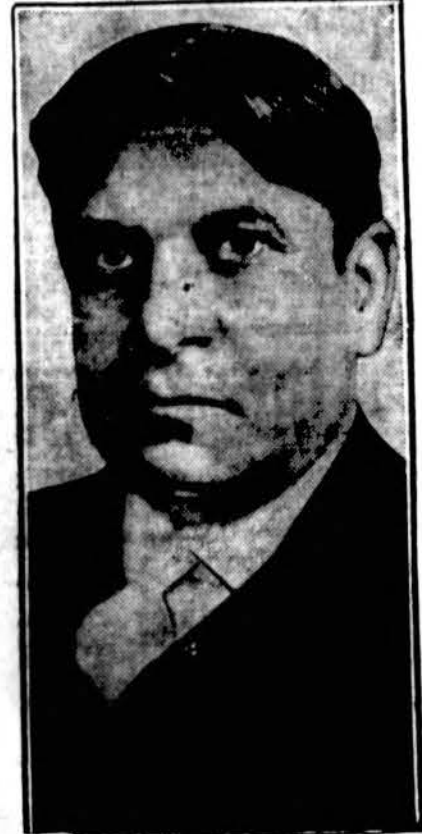
Senatorius Thomas D. Schall iš Minnesotos valstijos mirė Washington po susižeidimo automobilio nelaimėj.

Juk neperdidelis ir neper sunkus pageidavimas, kad ateinančiais metais visi Amerikos lietuviai, kurie dar neturi, įsigyti Vilniaus pasus (už 10 ct.) ir visi įlipintų į juos bent po vieną Vilniaus ženklelį už tiek vertės, kiek jisai arba ji pasigaili (nuo 5 centų iki 1 dolerio). Tačiau, kad tasai pageidavimas būtų įvykdytas, reikia, kad kiekvienoj mūsų kolonijoje susidarytų būrelis pasiunkusių žmonių, kurie, darbą suplan-