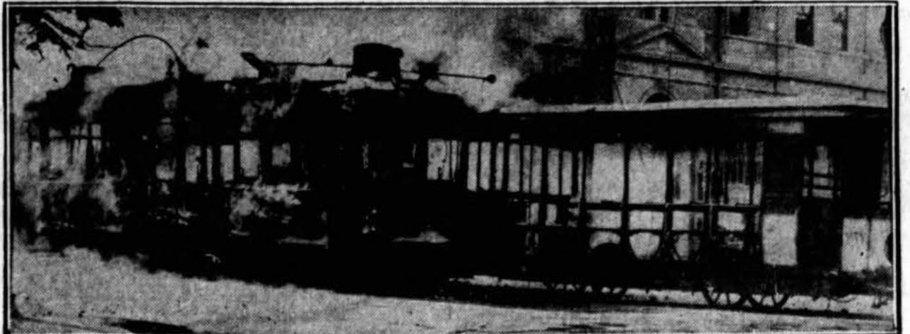
Strytkariai Egipto sostinėj — Cairo. Dabar egiptiečiai studentai buvo sukė- lę demonstracijas prieš Angliją ir tuos strytkarius buvo padėge. Demonstrantai išsiskirstė, kai atsiskubino stiprūs polici jos būriai. Anglija paskelbė perorgani- zavimą savo armijos ir į tą programą ineina karinių jėgų sustiprinimas Egipte.

— Abisinija yra tris kartus idesnė už Italiją, o gyvento- y yra 5 kartus mažiau. Ten batus nešioja tik karalius ir jo aukštieji valdininkai, o šiaip visi basi.