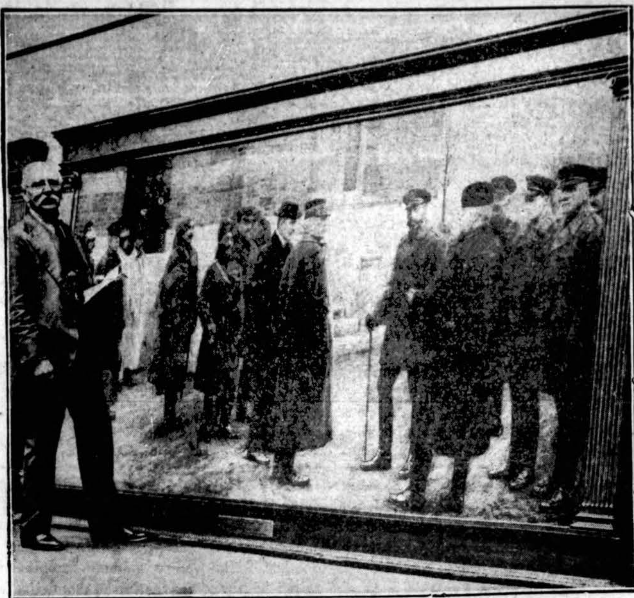
"Karalius Fronte" yra tai pagarsėjęs anglų piešėjo H. A. Oliverio paveikslas. Tasai paveikslas yra Anglijos karaliaus nuošavybė. Dabar Londone Karališkame Institute rengiama Oliverio paveikslų paroda. Tai Anglijos karalius tai parodai paskolino šį paveikslą.