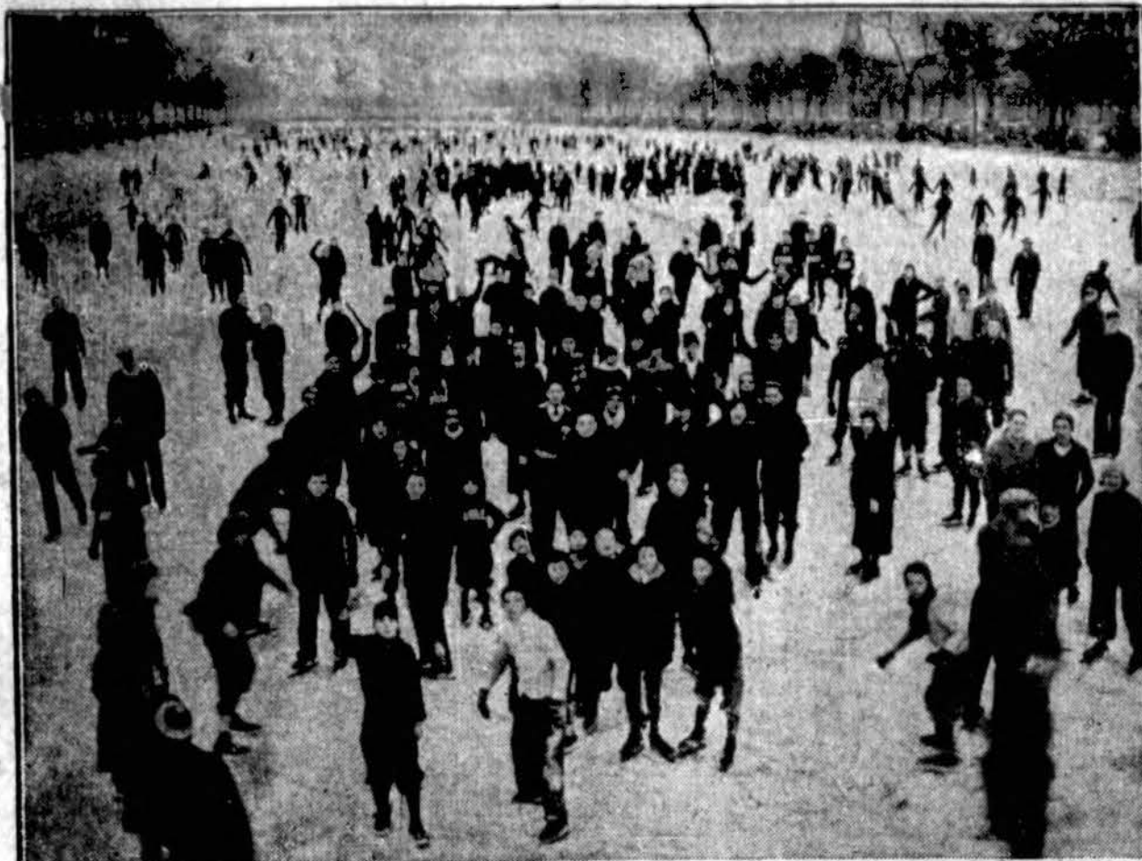
Vaikams džiaugsmas. Pastarųjų dienų šalčiai padarė Chicago vaikams šį "good time". Čia matome čiužinėtojų ant Midway.