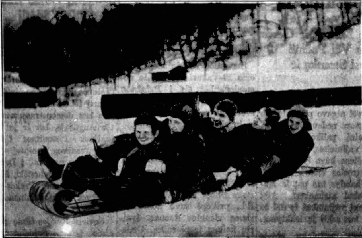
Linksmos snieguotos Kalėdos vaikams. Parodoma, kaip vaikai turi "good time" Chicagos apylinkė, Palos Parke.

2334 S. OAKLEY AVENUE, Chicago, Illinois