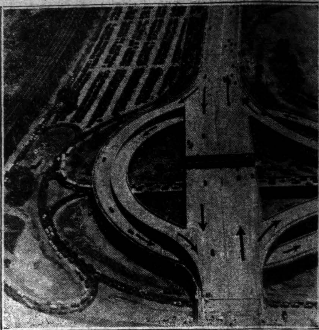
Čia parodoma, kaip automobiliams be jokių trafiko trukdymų patekus į viršutinį vieškėlį, jungiantį kelias New Yorko miesto dalis. Tuo būdu be trukdymų išvažiuojama ir gatvė.

KAIP IS GATVES PATEKTI Į VIRŠUTINI VIEŠKĖ!