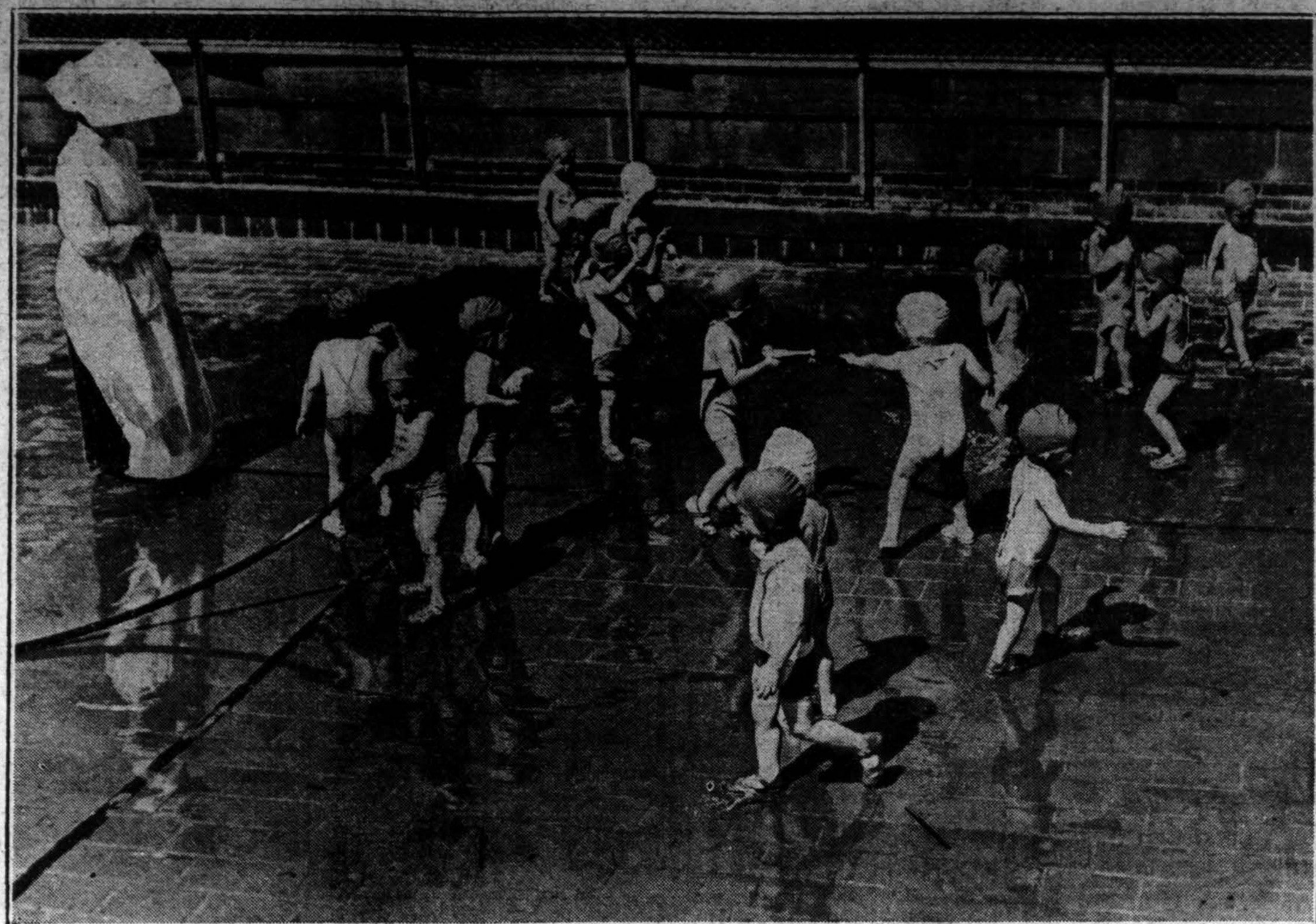
Nejaucia karščio. Maži Chicago piliečiai, našlaitukai Šv. Vincento prieglaudos, karštą dieną ant prieglaudos stogo, gerosios seselės priežiūroj, smagiai vienas kitą vandeniu vėdina.

Patarimas Atostogautojams: Išidėkite Kartoną "Dvigubai-Svelnių" Old Golds — Visuomet švieži.