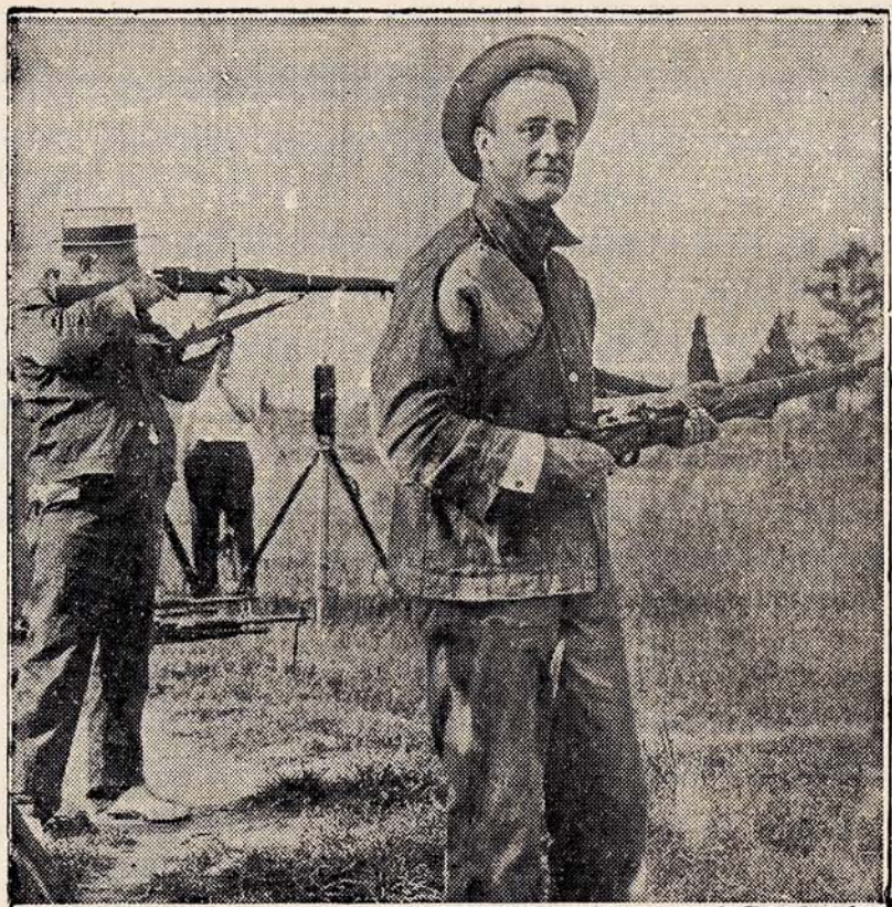
Iki šiol niekur netelpęs paveikslas. Tai ne paprastas ančių medžiotojas, tik dabartinis prez. Rooseveltas laike šaudymo į taikinių lenktynių. Sakoma, prez. Rooseveltas yra šaudymo į taikinių ekspertas. Šis paveikslas yra trauktas 1917 m. kada, gal, nei nemanė kuomet nors būtų J. A. V. prezidentu.

Pašūtinimas karštam vandenį ir braukymas spirito ir aliejaus mišiniu du kartus dieną, įtvėriant tą vietą ban-