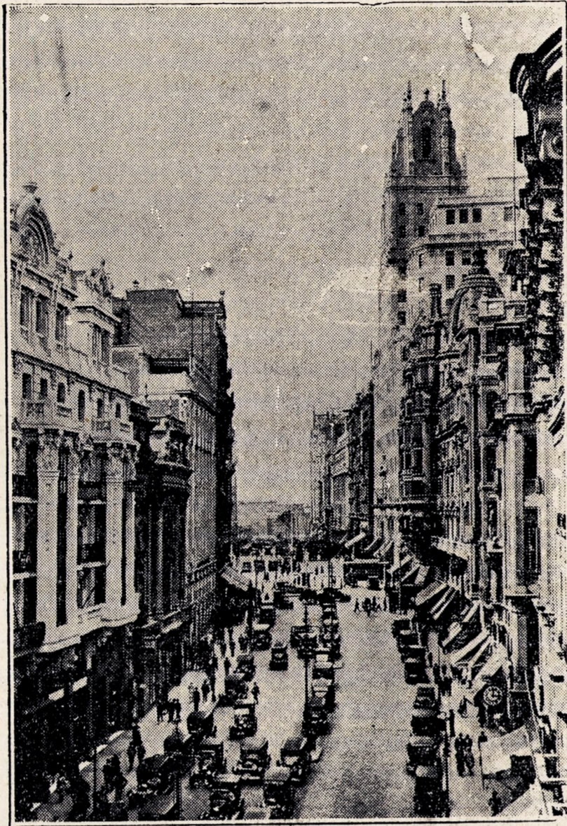
Ispanijos sostinės Madrido viena gatvių.

Trečiadienio "Draugan" tas nepateko, kadangi iki 9:00 vakaro apie tai neturėta žinios, o tuojau po 9:00 diena rasti pradamas spausdinti.