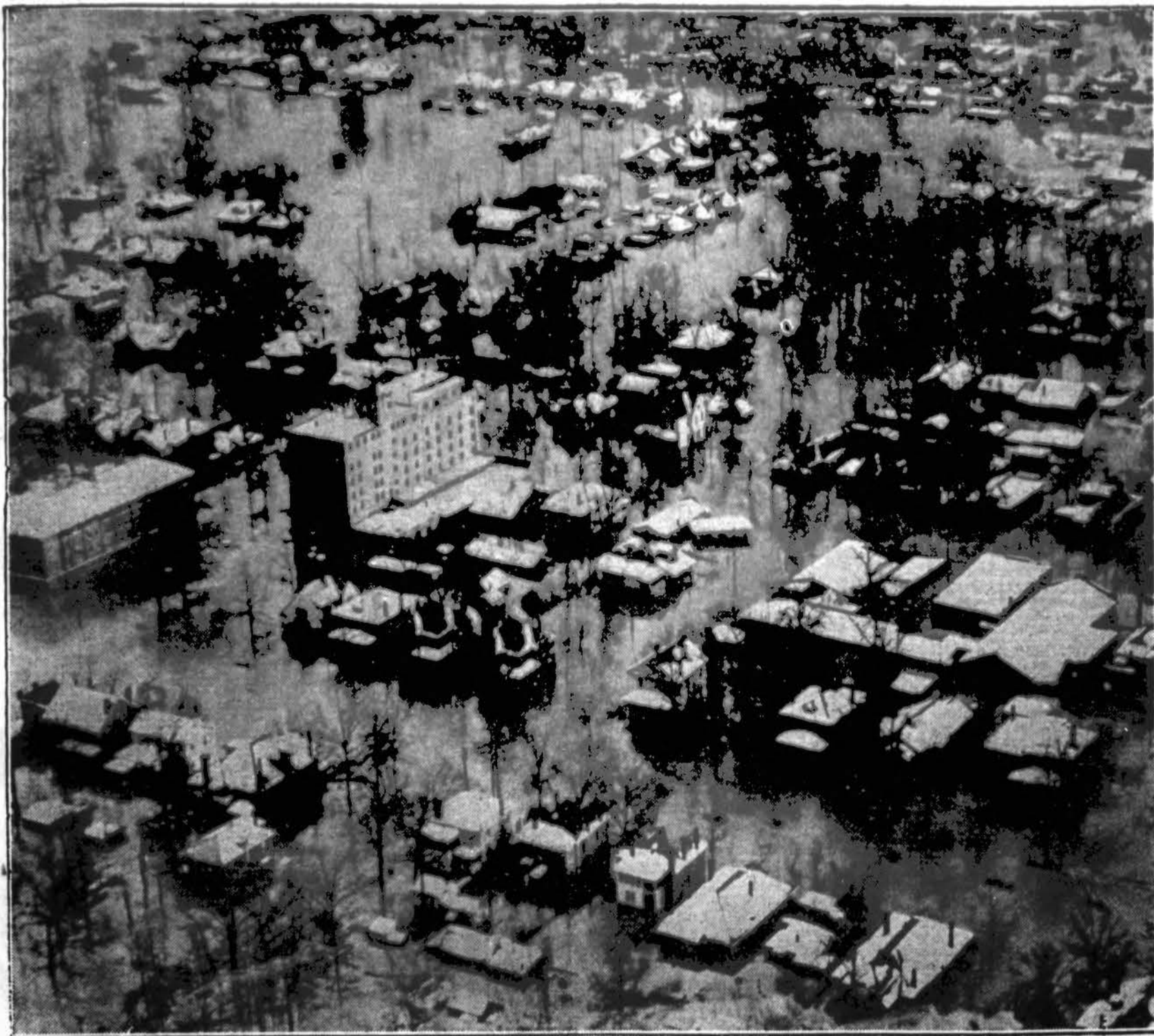
Visas miestas vandeny. Tai Louisville, Kentucky, miesto centras, kuris šiuo metu iki pusiau apsemtas ištikusio potvynio. Visam mieste tamsu, nes nutraukta elektros gamyba. Sustojus visokia prekyba. Apie 200,000 gyventojų netekę pastogės. Benamiai traukiniais gabenami į artimuosius miestus. Plinta visokios ligos, ypač tarpe vaikų.

Vestsaidiečiai korespondentai, platintojai visados patarė, kas tik pareikalaus katalikiško laikraščio. Koresp.