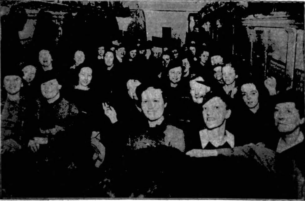
Į pagalbą nukentėjusiems nuo potvynio. Vienas traukinio vagonų su Chicago Raudonojo Kryžiaus slaugėmis, kurios išvyko į Evansville, Ind., teikti pagalbą nukentėjusiems nuo potvynio. Iš Chicago išvažiavo apie 50 slaugių.

LIETUVIS ADVOKATAS 33 North La Salle Street Chicago Telephone CENTRAL 1840 Vakarais ir šeštadieniais 6322 So. Western Avenue PROspect 1012