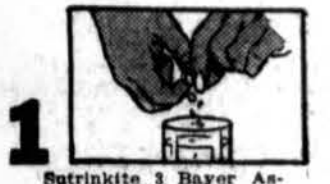
1. Sutrinkite 3 Bayer Aspirin tabletes 1-3 stikline vandens.