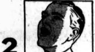
2. Gargaluokite du kart. Tas palengvina skausmą kuoms sklytininkym.