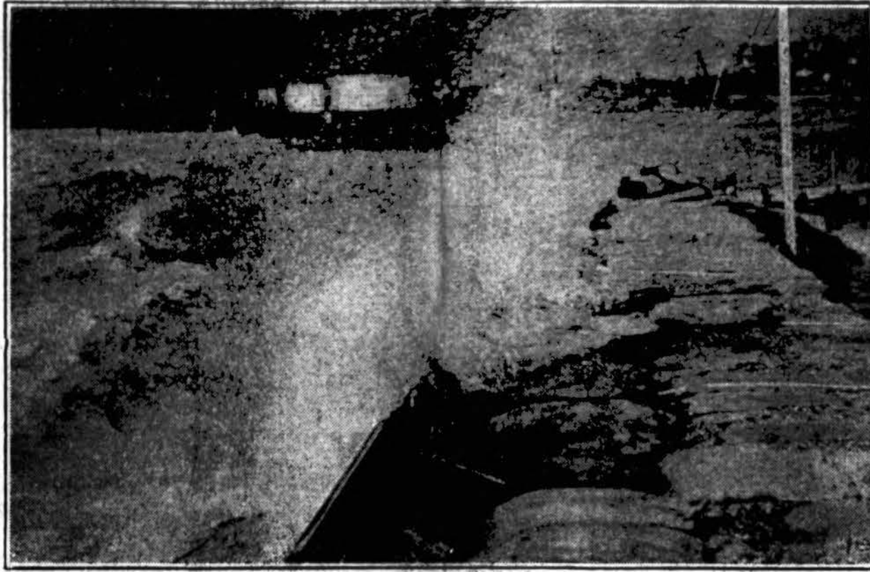
Memphis miestas išliko nuo potvynio, Anadien kilusi audra daužė Mississippi upės bangas į užtvankas pietų link nuo Memphis, kaip čia vaizduojama. Bet užtvankos atlaikė vandens spaudimą.