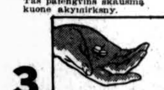
3. Paimkite 2 Bayer Aspirin tabletes su pila stikline vandens.

Kaip tik jaučiate, kad pagave slogas, sekite šį modernišką būdą. Jūsų gydytojas, mes žinome, užtvirtina šį būdą. Šis vaistinis gargaliavimas duos palengvinimą nuo skaudėjimo ir aštrumo gerklėje. Bayer Aspirin, kurį imsite viduriniškai, veiks nugalėti karštį ir skausmą, kurie dažnai eina kartu su slogom. Prašykite Bayer Aspirin jo pilnu vardu — ne vien "aspirin."