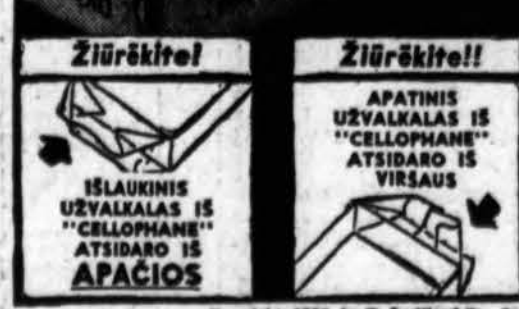
Copyright, 1937, by P. Lorillard Co., Inc.