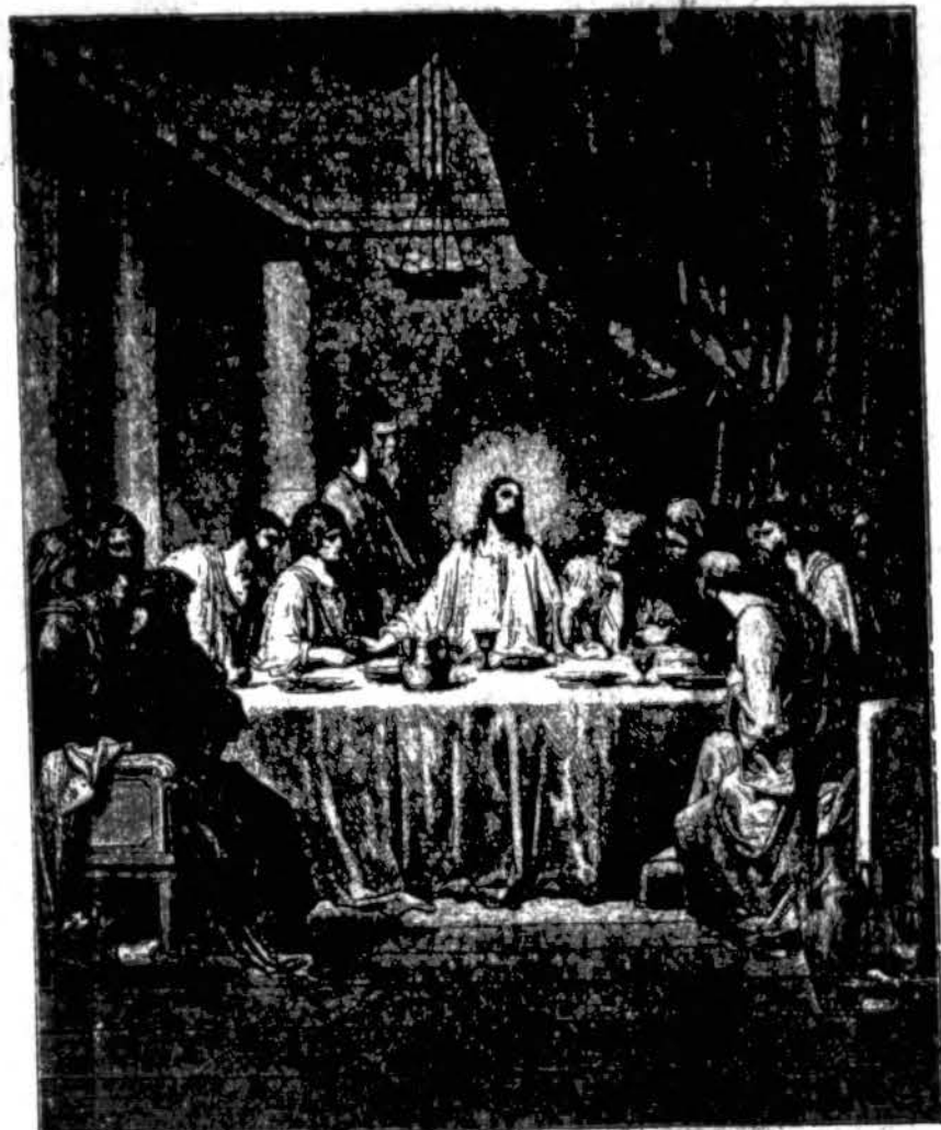
"Jiems valgant vakarienės, Jėzus ėmė duoną, palaikė ją ir laukė, davė savo mokytiniams ir tarė: Imkite ir valgykite; tai yra mano kūnas. Jis ėmė ir taurę, dėkojo ir jiems davė, sakdamas: Gerkite iš jos visi; nes tai yra mano kraujas naujosios sandoros, kuris bus išlietas už daugelį nuodėmės atleisti." (Mato 26, 26-29).

Iš oro biūro praneša, kad šiandien numatoma daugiau sniego. Kai kuriuose J. Valstybių dalyse siaučia sniego pūgos. Tad gali kilti ir Chicago.