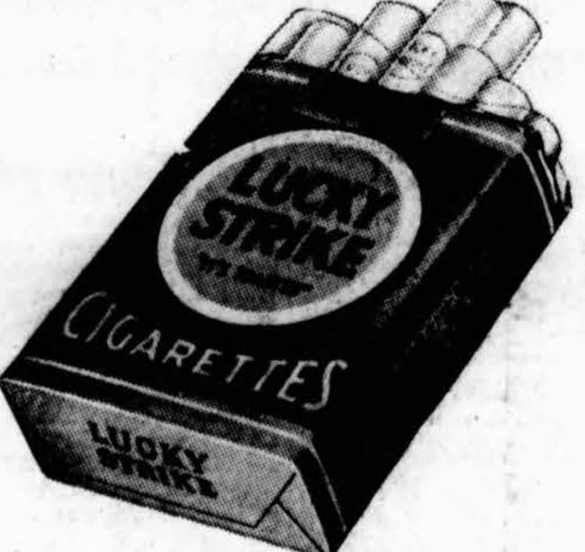
PUIKIAUSIAS TABAKAS—DERLIAUS GRIETINĖ

DABAR LOŠIANTI NAUJOJ COLUMBIA FILMOJ "LOST HORIZON"