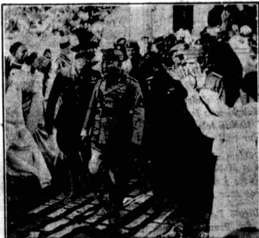
II Duce pas arabus, Italijos diktatorius Mussolini, lydi- mas Libijos gubernatoriaus Balbo (kairėj) senovės Libijos sostinėj, Cyrene, priima arabų vadus. Mussolini paskelbė jiems esąs "Islamo apgynėjas". Grįžęs Italijon Mussolini pasakė aštrią kalbą nukreiptą prieš Angliją.

Kuras buvo pakilęs apleisti Scrantoną, kad vienuolinia- me nuošalume didesniu atsi- davimu ruošti amžinybės ke- lionėn. Tačiau Scrantonui jis buvo nepamainomas; jam va- dovaujant scrantoniečiai susi- cėmentavo į konstruktyvę pa- jėgą, ir nebuvo kas jį tinka- mai pavaduoja. Kuomet praeitais metais ilstanti širdis išpėjo jį apie nepertolimą žemiškos kelio- nės galą, tai jis vėlėi pakito išeiti iš Scrantono, tačiau pa- rapijiečių asaros ir maldavi- mai taip jį sugraudino, kad dar daugiau juos pamylėjo ir tartum daugiau energijos į- gijo, pasiryžo su scrantonie- čiais pasilikti ligi galui, tik pasakvietęs kapinių tvarky- toją nurodė kur jam duobė iškast... Tenai, tat, dabar jį nulydėjome, kame jis ilsėsis tarp daugelio savo parapijie- čių, kuriuos jis pats pirma nulydėjo.