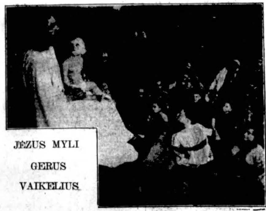
JEZUS MYLI GERUS VAIKELIUS.