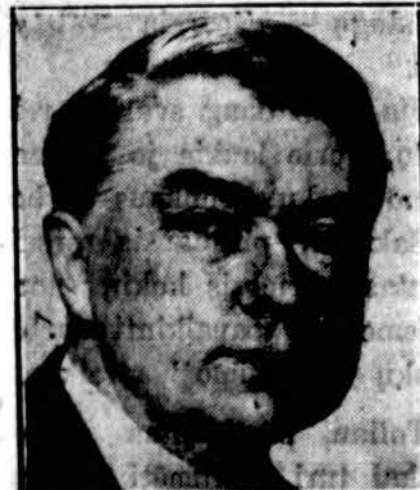
Mirė. John Drinkwater, žymus Anglijos dramaturgas ir novelistas, šiomis dienomis mirė Londone sulaukęs 54 m. amžiaus.

Jau teko skaudžiai patirti kiek daug žalos mūsų tautai ir Bažnyčiai sudaro lietu-