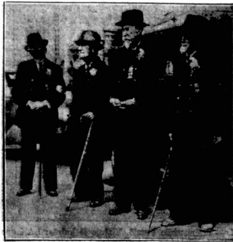
"Boys in blue". Chicagiečiai, civilio karo veteranai, dalyvavę mirusių atminimo dienoj parade. Nedaug jų beliko ir kasmet skaičius vis mažėja.

vauti iškilnėse. Ciceriečiai turi kuogražiausia pasirodyti. kopolyčios pašventinime, nes tai istorinis įvykis; 3) nuo Šv. Antano draugijos, kuri kviečia dalyvauti 25 metų jubiliejaus paminėjime, 13 d. birželio. Nutarta dalyvauti ir 5 dol. prisidėti prie jubiliejaus knygos. Čia pat pranešta, kad Liet. Kareivių drauga prisideda su 10 dol., Raudonos Rožės klubas 5 dol. Nors ta dieną Raud. Rožės klubas rengia pikniką, bet ir jis prisideda. Bravo Ciceros draugijoms ir klubams. Federacijos 12 skyrius giria tokią draugijų vieningą darbuotę. Tik dr-jų ir klubų išrinkti atstovai turėtų lankyti skyriaus susirinkimus. Kai kurie turi išrinkę po du ar tris atstovus ir nei vienas jų neatsilanko. Tai apsilaidimas. Bene reikės išvardinti tokius atstovus.