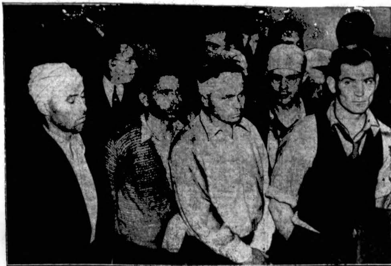
Prieš teisėją. Grupė policijos sumušų praėjusį sekmadienį streikuojančių Republic Steel Co., So. Chicago, darbininkų, po aptvarstymo pristatyti prieš teisėją Felony teisme.