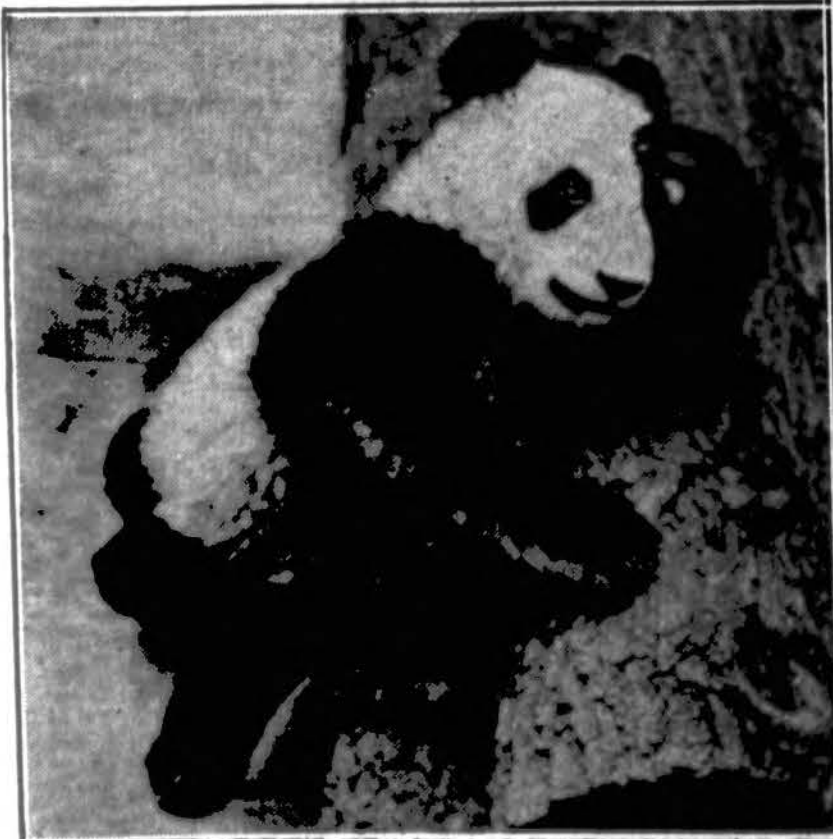
Viešna Brookfielde. Žvėrelis, meškų veislės, vadi- nama Panda iš kitų kraštų parvežta į Brookfield žvėry- ną (šale Chicago). Viskas jai čia svetima.