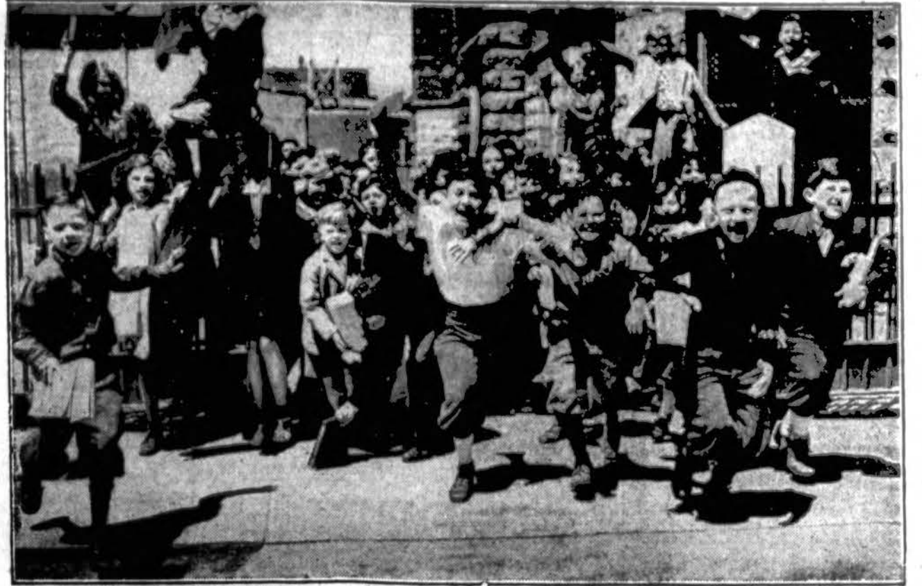
Vasara skaistulė Kviečia į laukus — Bėgame lenktynių, Dainos lydi mus.

Kakarykū, saule, Kaitink dar šilčiau! Duok mums spindulėlių Zaisių au au au!