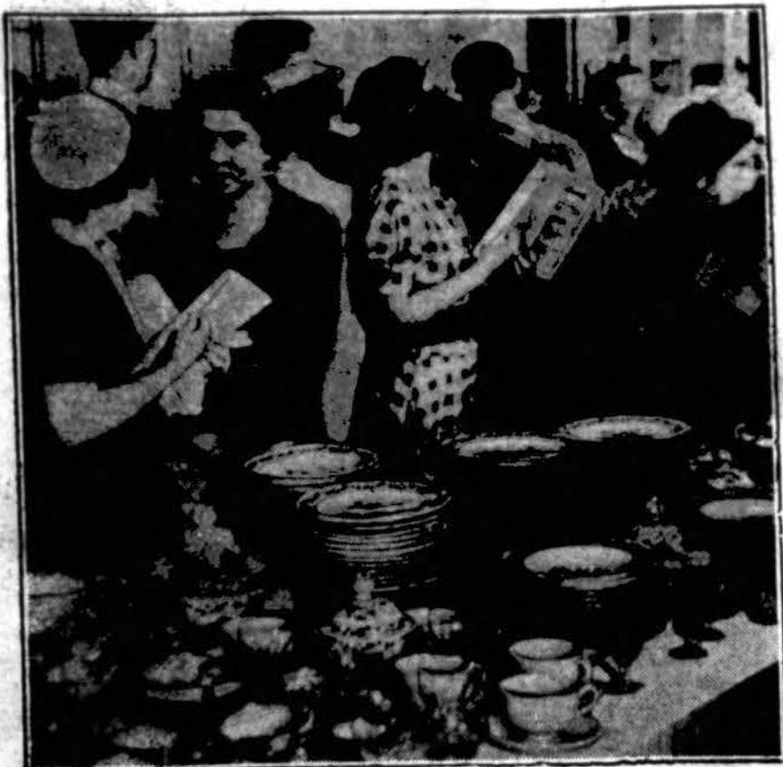
Pardūda iš varžytinių. Garsaus Chicago "visuomeniškos naudos" bizniero, milijonierio S. Insullo, kuris depresijos metu nuvešė milijonus žmonių pinigų ir pats subankrutavo, judamasis turtas dabar parduodamas iš varžytinių. Čia matome išstatytus varžytinėms brangius indus.

Parduodama visose grosernėse ir garantuoja Kellogg iš Battle Creek, Michigan.