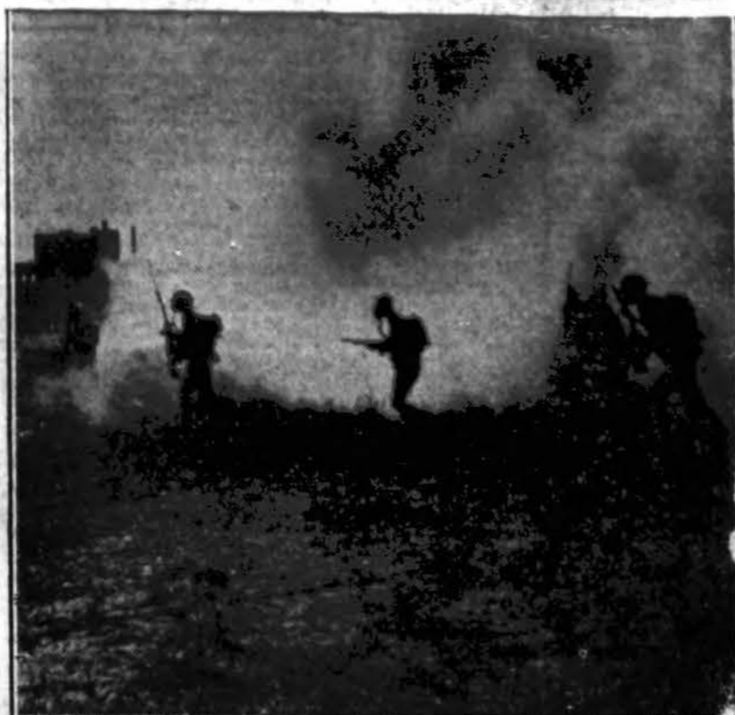
"Karas" Chicagoj. Illinois Nacionalės Gvardijos 33 divizijos kariai daro praktikus Chicago jubiliejinėms iškilnėms rugp. 14 ir 15 dienomis, Soldier's Fielde.