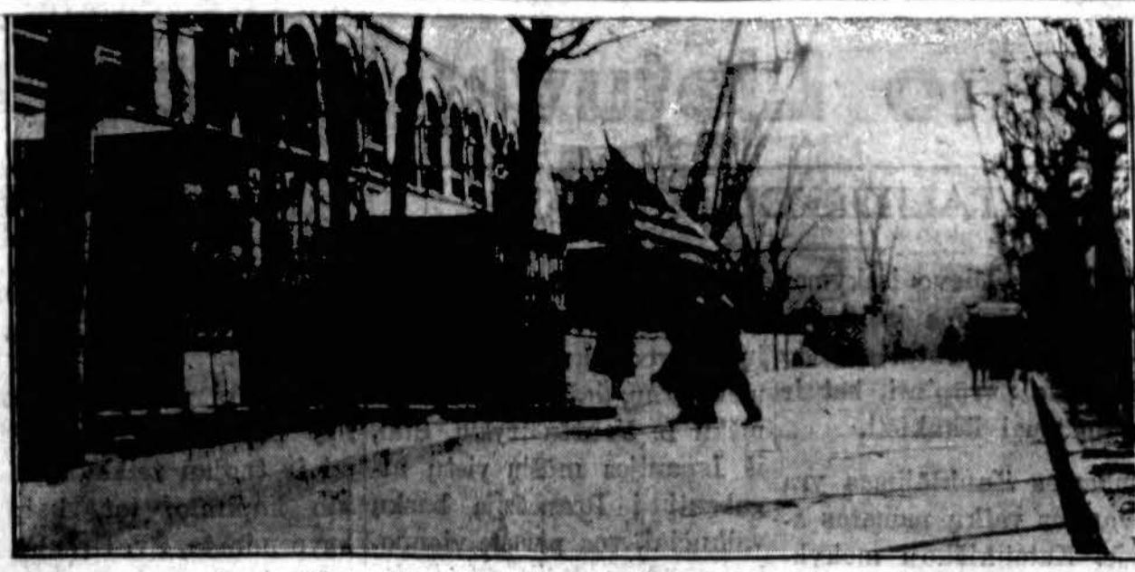
J. A. Valstybių Konsulatas Peipinge saugojamas karių.

Apskritai, kooperatyvai Lietuvos ūkyje, jo pažangoje turi didelės reikšmės. Tam suprasti pakanka tik kelių skaičių. Pieno perdirbimo bendrovės per metus surenka ir perdirba ir sviestą apie 100,000,000 kilogramų pieno, pagamina per 17,000,000 kilogramų sviesto ir išmoka ūkininkams už pieną apie 10,000,000 litų. Prekybos kooperatyvai kartu su savo centru „Lietūkiu“ per metus parduoda už daugiau kaip 125,000,000 litų prekių. Prekybos kooperatyvai kartu su pieno perdirbimo bendrovėmis jau 1937 metais surinko ir eksportavo apie 100,000,000 kiaušinių. Vien kaimo kredito kooperatyvai yra davę 75,000 asmenų pasokolas, jų yra išdavę apie 40,000,000 litų, o indėlių turi apie 20,000,000 litų.