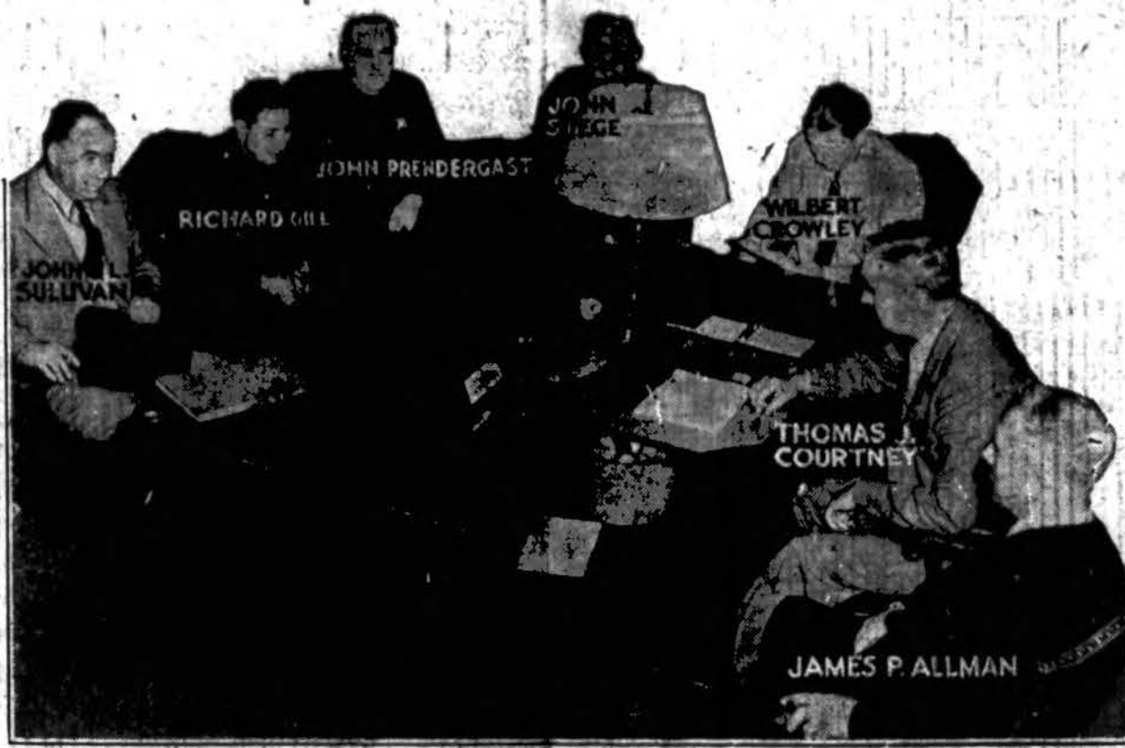
Chicago policijos viršininkas J. P. Allman turi konferenciją su policijos kapitonais ir apskrities prokuroro padėjėjais. Tariausi imtis priemonių prieš moronus (lytinius pavaišėlius), kurie užpildinėja ir žudo mergaites ir moteris.