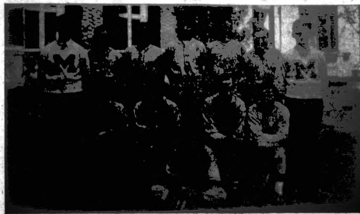
MARIJANAPOLIO KOLEGIJOS 1934 METŲ BEISBOLININKAI