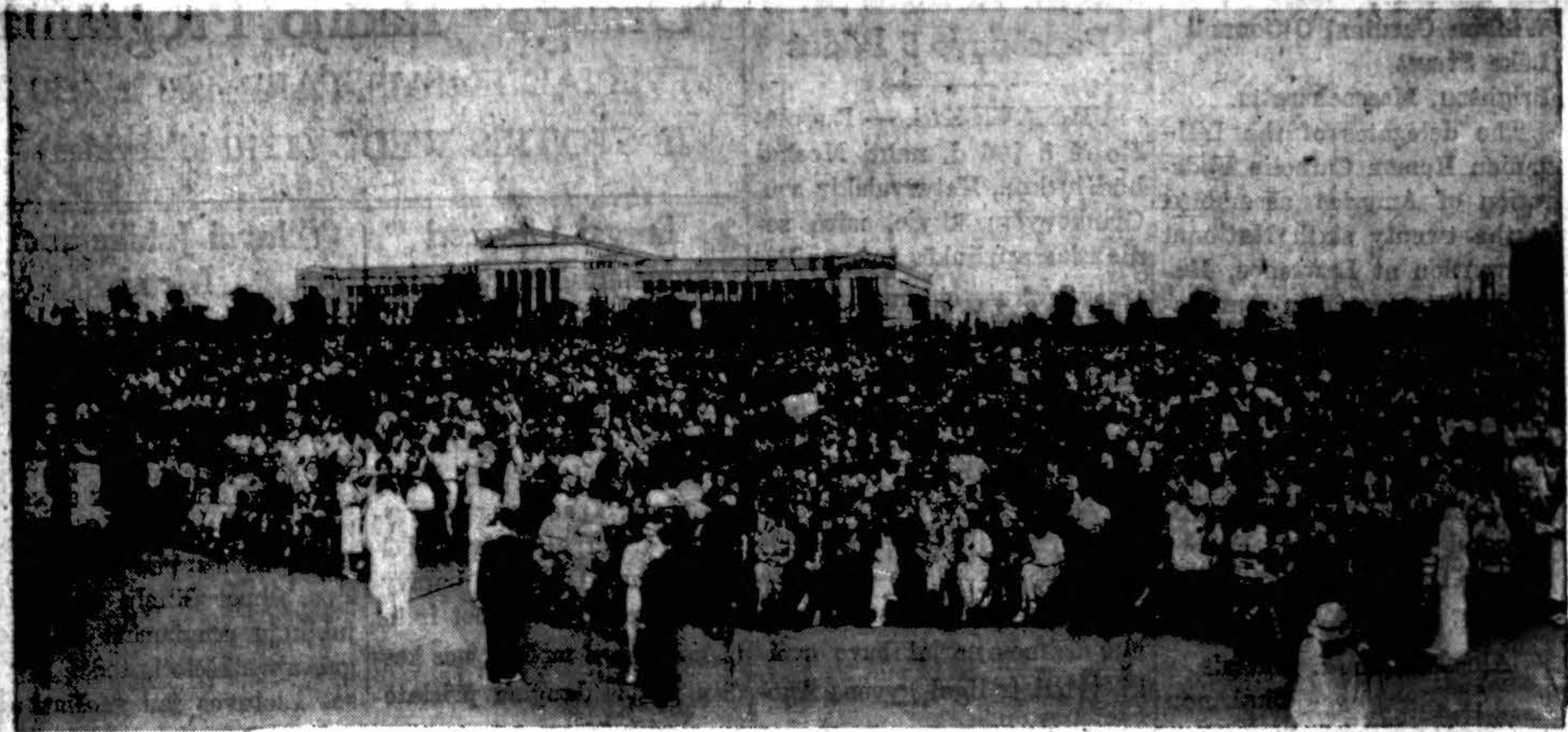
Didžiausias pasaulio teatras. Didžiausiu pasaulio teatru, be abejonės, yra vasarinis teatras Chicagoj Grant Parke po atviru dangum. Kelios dešimtys tūkstančių žmonių šiltais vasaros vakarais, vėsinančių esamo netoli Michigan ežero, susėdę gali klausyti muzikos ir žymiausių Amerikos artistų. Šis atvaizdas nutrauktas praėjusį sekmadienį besiklausant Chicago Simfonijos orkestros ir garsaus smuikininko virtuozo Heifetz. Tos rūšies koncertai baigsis su Darbininkų Diena, rugsėjo 6.

prie bažnyčios s. & gatvės ir klebonijos buvo padaryti gyvų vainikų vartai.