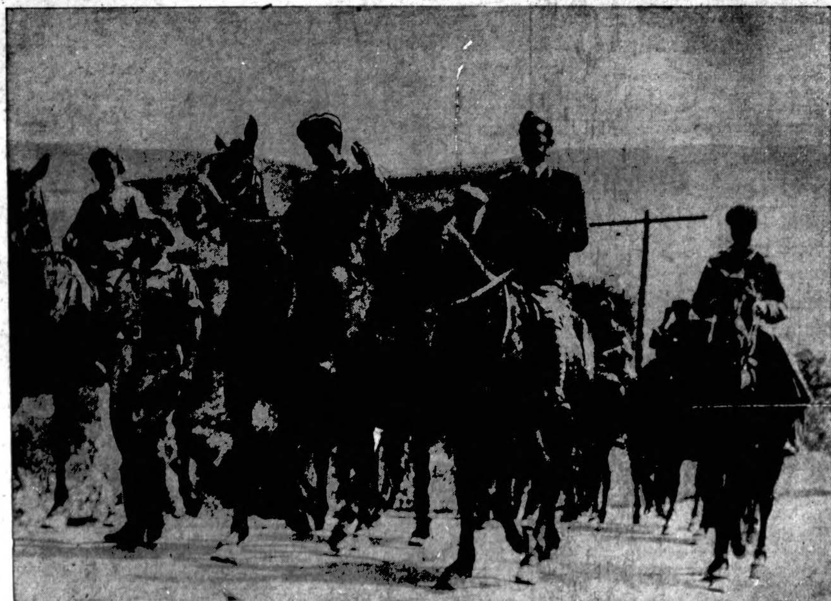
Pirmieji. Ispanijos sukilėlių karininkai priešaky kariuomenės, kuri po dvylikos dienų puolimo sulaužė lojalistų jėgas, pirmieji įeina į Santander, vieną didžiausių šiaurinėj Ispanijoj miestą.

rovų buvo šiose operose: "Eugenijus Oneginas" aplankė 7, 483 žiūrovai, "Radvilą Perkūną" — 5,035 žiūrovai, "Kitežas", — 4,987, "Traviatą" — 4,749 ir t.t. Iš viso buvo pastatyti 127 spektakliai, kuriuos aplankė 68,198 žiūrovai.