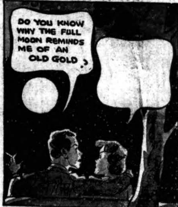
PIEŠINYS NO. 10

KAIP ŠI MERGINA ATSAKYJ TAI? Suteikite praleistą kalbą tuščiojam balinui... (naudokite oficialią atsakymų formą, kurią jūs galite gauti bilie cigarečių krautuviėje) Vyras po kair- sako: "Do you know why the full moon reminds me of an Old Gold?" Štai yra kai kurie sugestuojami atsakymai: A. "Because they're both Double-Mellow." B. "Like the moon, prize crop tobaccos are one of nature's wonders." PASTABA: — Naudokitės savo idėjom, savais žodžiais. Skaitykite taisyklės.