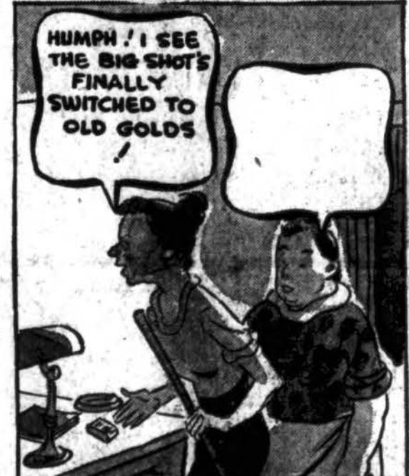
PIEŠINYS NO. 12

KĄ SAKYS ANTROJI DARBININKĖ? Suteikite praleistą kalbą tuščiojam balinui... (naudokite oficialią atsakymų formą, kurią jūs galite gauti bilie cigarečių krautuviėje) Moteriškė kairėje sako: "Humph! I see the big shot's finally switched to Old Golds!" Štai yra kai kurie sugestuojami atsakymai: A. "Well, maybe he ain't so dumb as we figured." B. "I guess we can throw out these tough medicines, then." PASTABA: — Naudokitės savo idėjom, savais žodžiais. Skaitykite taisyklės.