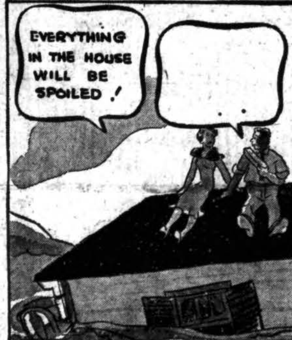
PIEŠINYS NO. 11

KĄ SAKYS VYRAS? Suteikite praleistą kalbą tuščiojam balinui... (naudokite oficialią atsakymų formą, kurią jūs galite gauti bilie cigarečių krautuviėje) Moteriškė kairėje sako: "Everything in the house will be spoiled!" Štai yra kai kurie sugestuojami atsakymai: A. "But it takes more than a flood to spoil our Old Golds!" B. "Too bad our house wasn't Double Cellophaned like these Old Golds." PASTABA: — Naudokitės savo idėjom, savais žodžiais. Skaitykite taisyklės.