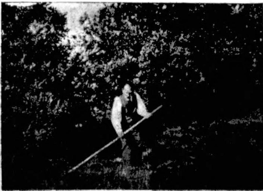
Gražu mūs Lietuvoj. Paskėndusiems didmiesėjų dūmuose malonu yra prisiminti Lietuvoje šienapiētės ir kvepiančios šienas. Atvaizde Lietuvos prez. A. Smetona savo tėviškėj vasarodamas varo pradalgę.

Spalį 24 d. sodaliētės ren- gia card party. Kortų lošimas įvyks parapijos salėje trečių valandą popiet. Laukiama