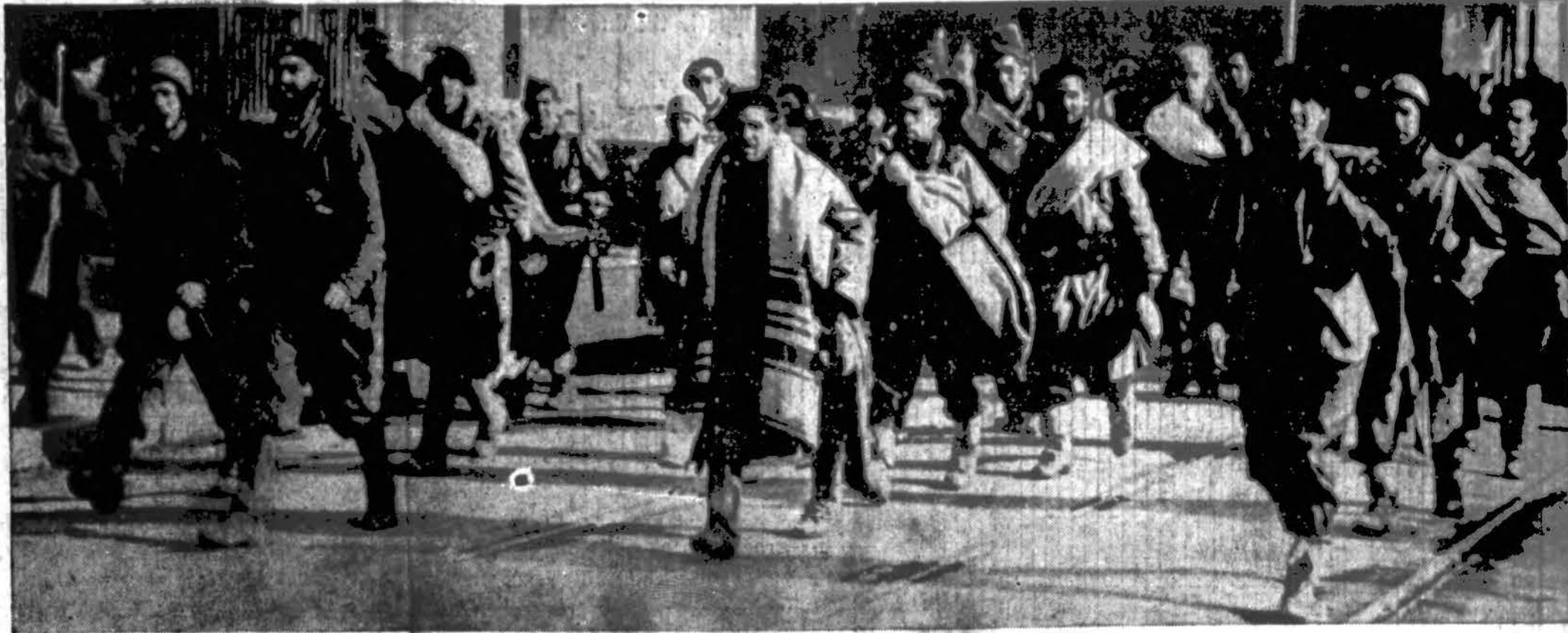
Ispanijos radikalų milicininkai Mahon mieste, Malorea saloje, Viduržemio jūroje. Nacionalistai blokuoja salą ir Mahono radikalus spaudžia bėdas. Prancūzija pasiryžusi juos vaduoti. Bet Anglija pataria prancūzams neikišti ten savo nosies.

Šių gaivalų spaudžiama Prancūzijos vyriausybė nežino kas daryti. Žada rytoj šaukti ministrų kabinetą ir nepaprastą posėdį ir pasitarti, kas veikus.