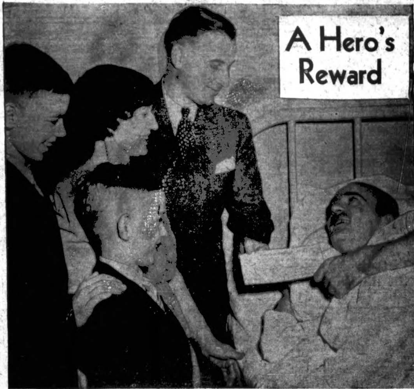
A Hero's Reward

Budriko žymūs radio programai: Nedėlioje: WCFL - 9:00 KIL, kaip 7:30 v. vak. Ketvergais: WHFC - 1420 KIL, nuo 7 iki 8 val. vak.