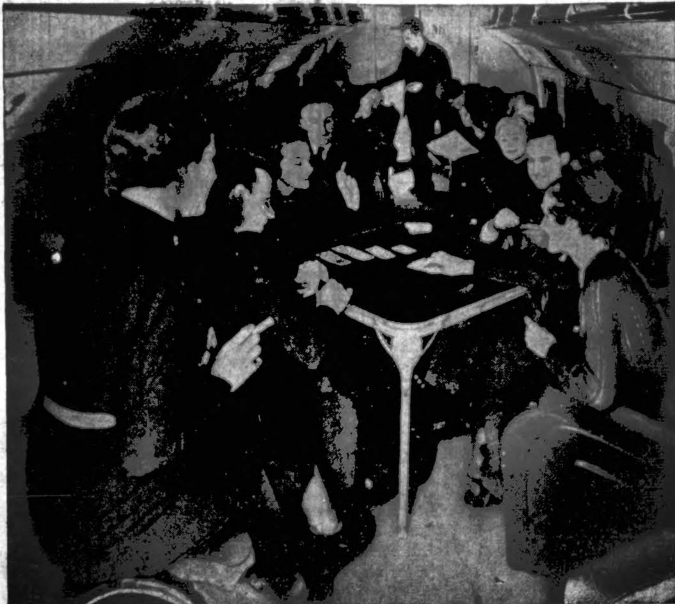
Taip atrodė nukritusio ir sudužusio milžiniško Douglas DC-3 lėktuvo vidus. 10,000 pėdų aukštumoje smogė į kalną ir 19 skridusiųjų akimirkoj žuvo.