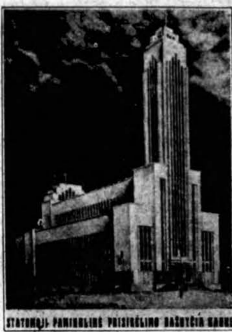
Keistučio Spulgos Pastatas

Sekretorius J. P. Evaldas plačiai aiškino spulgos finansinį stovį. Įdomu buvo klausyti. Sakė, kad prieš depresiją spulga neturėjo nei vieno forklozuto namo. Per depresiją turėjo forklozutu 36 namus. Iš tų namų iki šiol parduota 14 namų. Reiškia liko 22 namų. Toliau aiškino, kad šiuos visus namus dabar gauna būd greit parduoti už tą sumą, kuri spulgai kainavo.