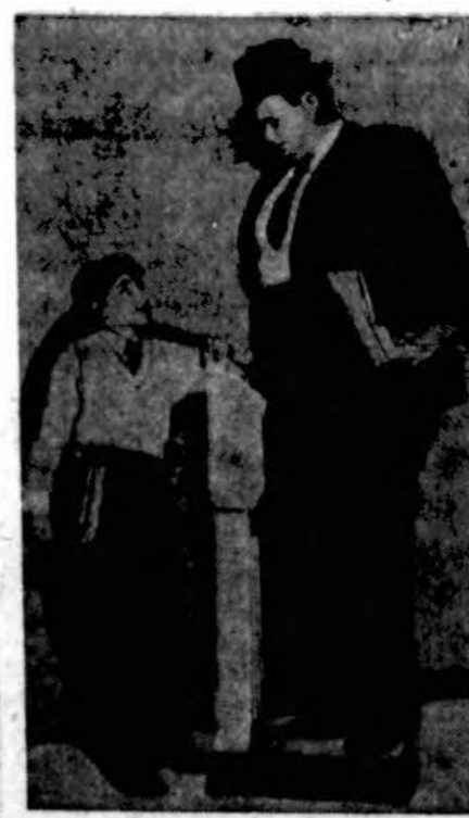
"Dovidas" ir "Galijotas".

KAUNAS (Tsb.) — Rugsėjo mėn. 15 dieną Vytauto Didžiojo Universitetas Kaune pradėjo naujus mokslu metus. Tą dieną Universitete buvo naujų studentų priėmimas — imatrikuliacija. Į visus fakultetus buvo paduota 845 prašymai. Priimta 536 nauji studen-