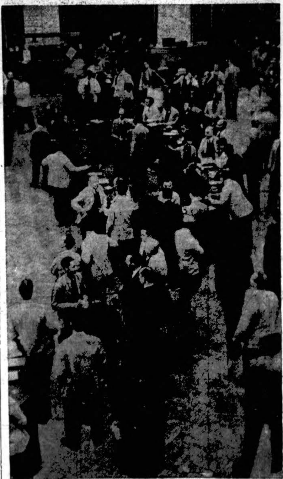
Didelė biržoje panika. Per radio ir spaudą alarmuojama apie nepaprastą biržoje šerų kritimą. Šiame atvaizde parodoma Chicago's birža, kur eina skubus pardavimas ir pirkimas šerų, kurių kaina laipsniškai nukrito. Biržoje panika yra blogas ženklas. Kai kas dėl to spėja užeinant didesnę depresiją, negu neseniai pergyvenome.

Pasinaudokit visi: dideli ir maži, — išsikirk šį zuikiu tikietai ir damokėjęs 15c, Vytauto Parke spalio 24 d., gausit tris tikietus Bingo žaidimui, vertės 25c.