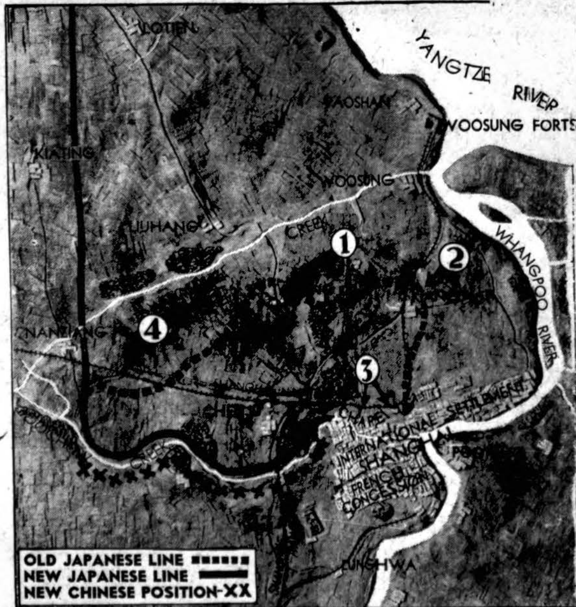
Iš kinų - japonų karo lauko. Pastarosios žinios praneša apie didelius japonų kariuomenės laimėjimus Shanghai apylinkėje. Po smarkių mūšių japonai paėmė Tazang (1), didelę kinų apsigynimo bazę, Kiangwang (2) ir šiaurinę Chapei (3) geležinkelio stotį. (4) parodo, kur japonai perkirto geležinkelį tarp Shanghai ir Nanking. Chapei, vienu kinų miestas, padilėjos šalį. Ir ten apsigyve-