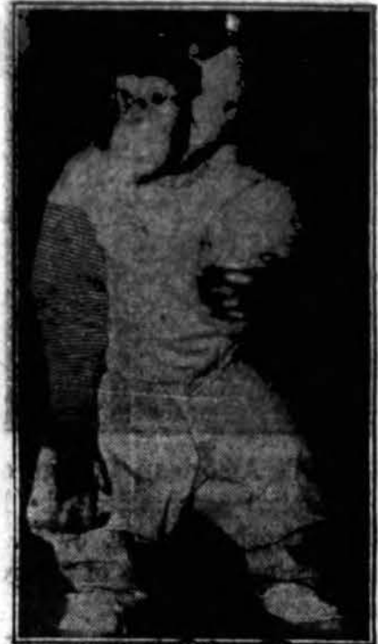
Mas'totas. "Skippy", Lincoln park, Chicagoj, žvėryna čimpanze bus maskotas metinio Chicago Park Districto futbolo žaidimo tarpe Santa Clara (Calif.) ir Marquette universitetų tynų. Žaidėjas bus spalio 30 d. po piet, Soldier's Fielde. Tikietų to žaidimo žiūrėti iš anksto galma gauti visų parkų "fieldhouse" se".