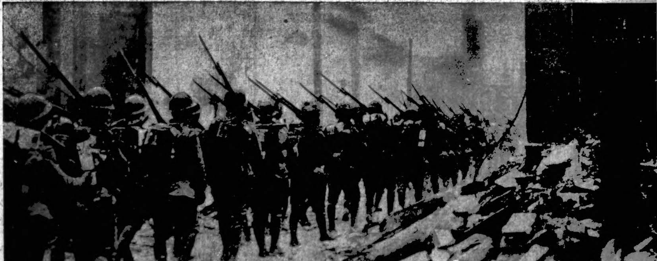
Užima Shanghai. — Po smarkių kovų japonų kariuomenė įeina į Shanghai ir paima miesto kontrolę. Shanghai buvo didžiausias Kinijos miestas. Atsimetus kinų kariuomenė dabar koncentruoja jėgas ginimui Nankingo, savo sostinės.