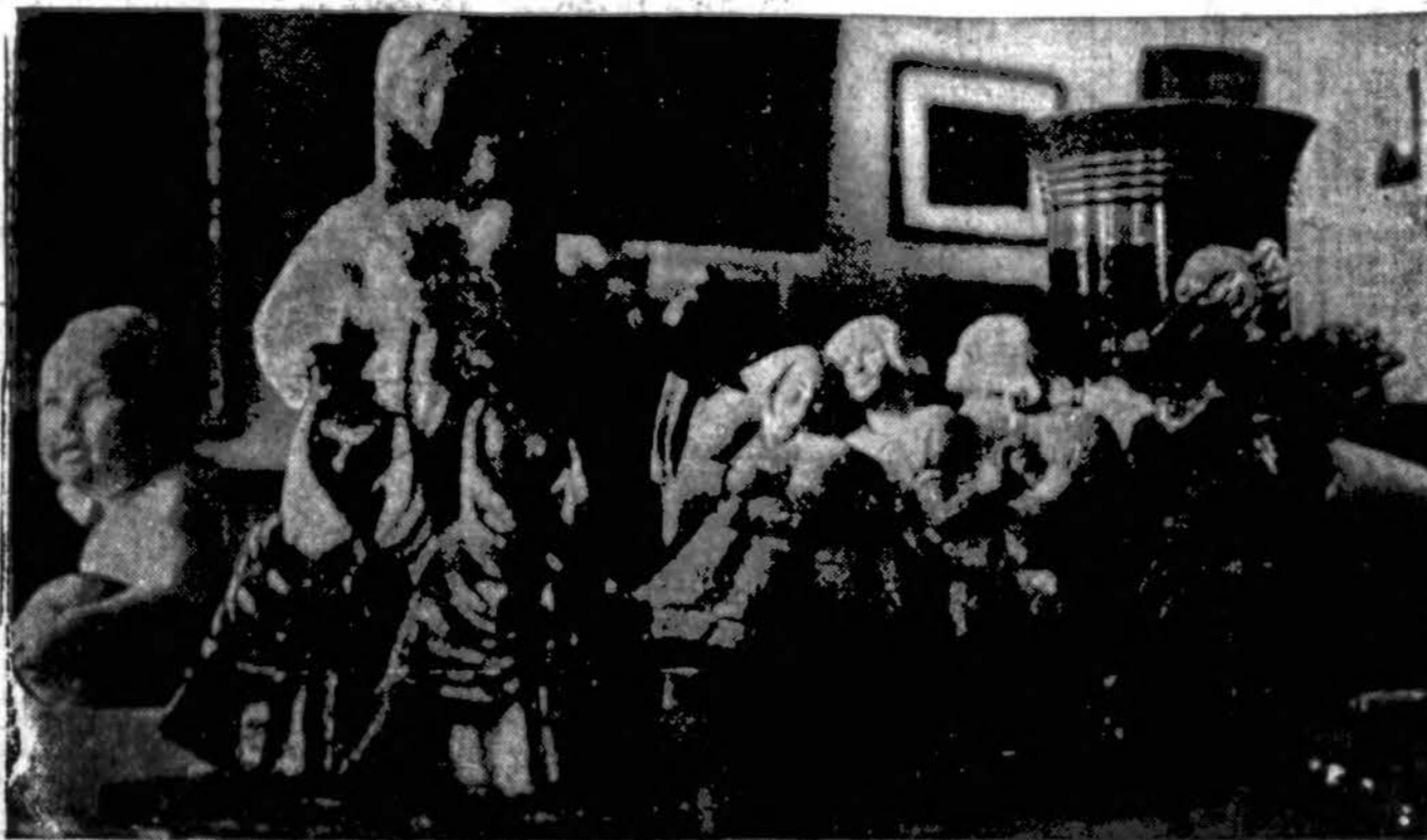
Is moterų meno parodos. Kaune neseniai buvo surengta Lietuvos moterų meno paroda. Šiame atvaizde vienas tos parodos vaizdų.

TORONTO, Kanada. — Kanados Katalikų Tiesos draugija perėjusiais metais išplatino 250,000 katalikiškų brošiūrų ir 5,000 knygų.