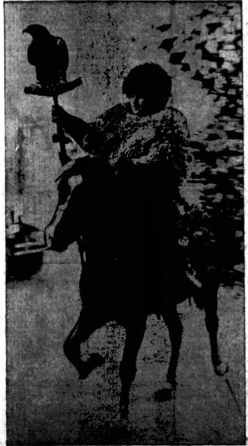
Berlyne atidaryta tarptautinė medžioklės paroda, kurioje tarp kitų išstatyta ir šis medžioklės simbolis: Suomis medžiotojas raitas leidžiasi medžioklėn ir rankoje laiko iškeltą gyvą prijuokintą auksinės raišies erelį.