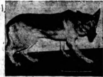
Sargas meno brangenybių.

"U will Like Us" 4030 Archer Avenue Tel. Virginia 1515