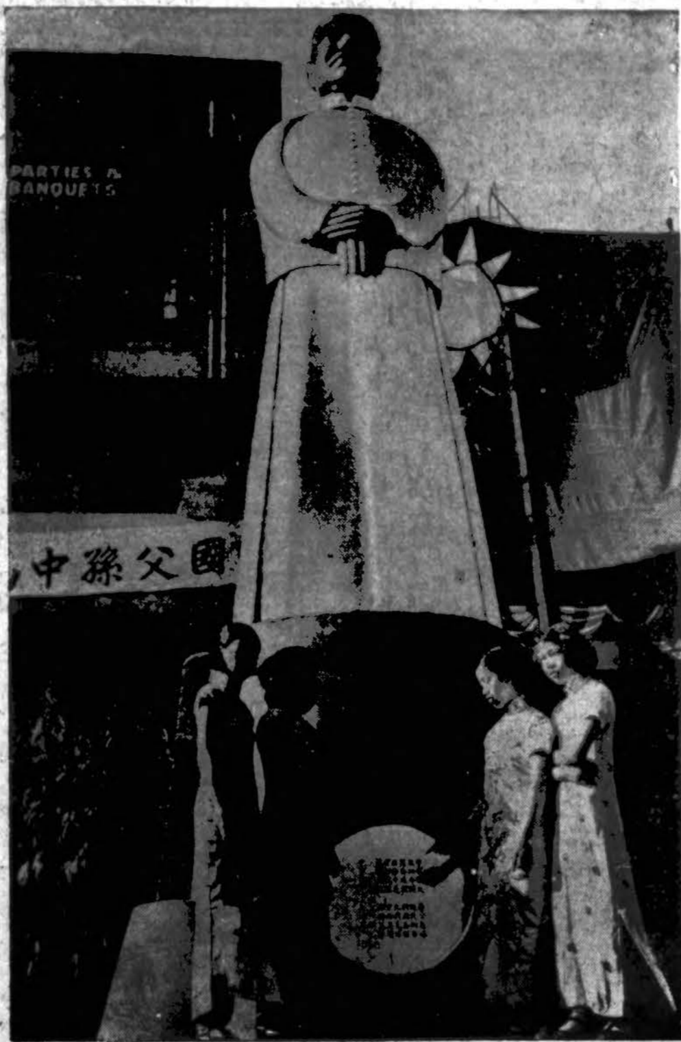
Įamžinta atmintis. Šiomis dienomis San Francisco, Calif., atidengtas paminklas dr. Sun Yat-Sen, moderninės (respublikoniškos) Kinijos tėvo ir pirmojo prezidento. Vėliau jis buvo priverstas bėgti iš savo krašto ir pabėgimui pasirinko Ameriką. Paminklas gryo plieno ir raudono granito, 14 pėdų aukščio.

Gyvenimo vanduo yra saldus ir atgaivinantis, išganytom šuliniai yra gilūs ir neišsemiami; bet niekas negali gerti kaip tik tie, kurie semia. "Semsime su džiaugsmu vandens iš gelbėtojo šaltinių".