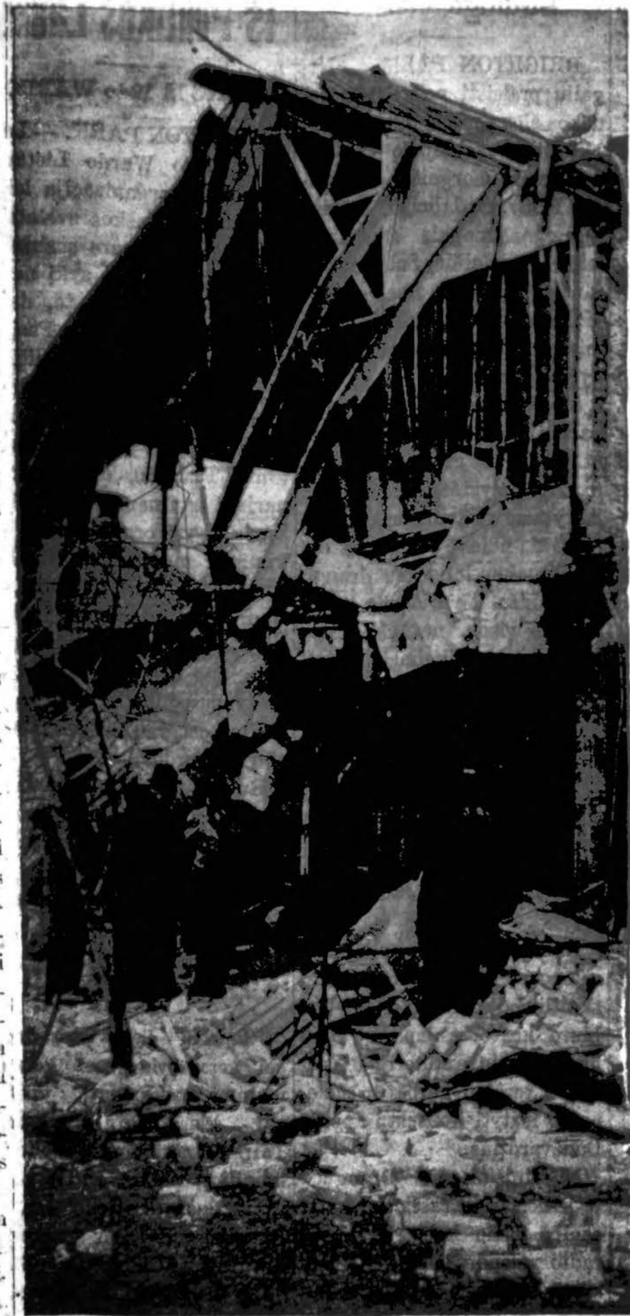
Eksplozija pieno fabrike. Užvakar Chicagaj įvyko eksplozija. Carnegie Illinois Steel fabrike, prie 82 gatvių (So. Chicago). Du darbininkai žuvo ir apie dešimt sužeista.