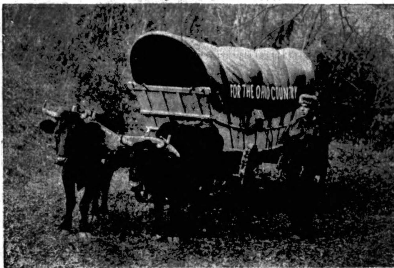
Šie jaučiai ir vežimas iš Marietta, O., bus panaudoti iškilimams Amerikos pijonierių atminimui. Su šiuo vežimu iš Ipswich, Mass., bus važiuojama į Marietta taip, kaip kitados yra vykę pijonieriai į šiaurvakarų teritoriją ieškodami laimės — tinkamos sau įsigyventi vietos. Pagal plano su šiuo vežimu iš Ipswicho bus išvažiuota gruodžio 3 d. ir Marietta bus pasiektas atein. metų balandžio 7 d.