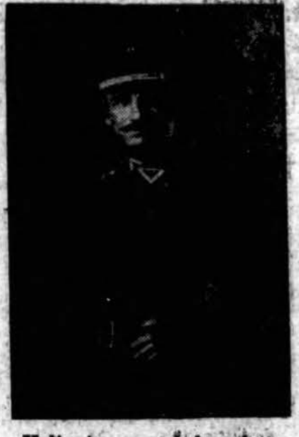
Velionis gen. Žukauskas

KAUNAS. — Lapkričio 23 d. nuo širdies ligos mirė gen. Silvestras Žukauskas. Kūnas buvo pašarvotas Karo muziejuje. Minos žmonių lankė atiduoti pagarbą Lietuvos nepriklausomybės kovų didvyriui. Iškilmingos laidojimo įvyko lapkričio 28 d. Ilgamečiui karvedžiui buvo suteikta pri-deranti kariška pagarba.