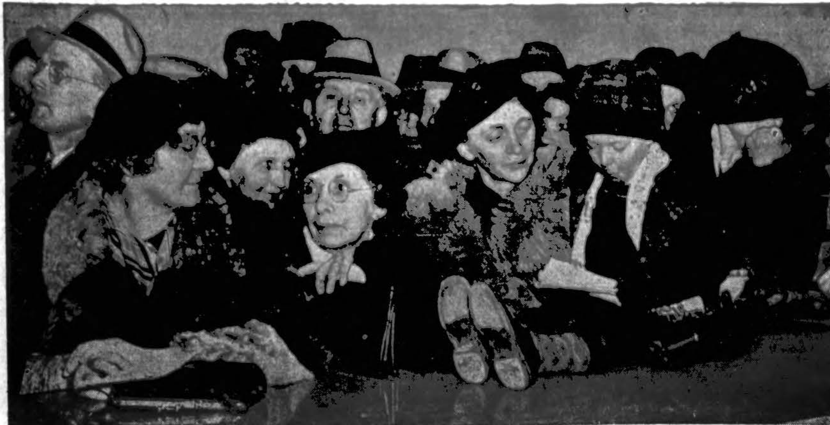
Ereka taksus. Cook apskrities išdininko ofisas, užsigrūdęs nejudamųjų nuosavybių savininkais užsmonkėti taksus už antrą pusmetį 1936 m. Paskutinė taksams užmokėti diena (deadline) buvo vakar. Kurie nesumokėjo iki tai dienai ir neprotestavo prieš aukštus taksus, tiems su šia diena prasiđėjo bausmė 1 nuoš.