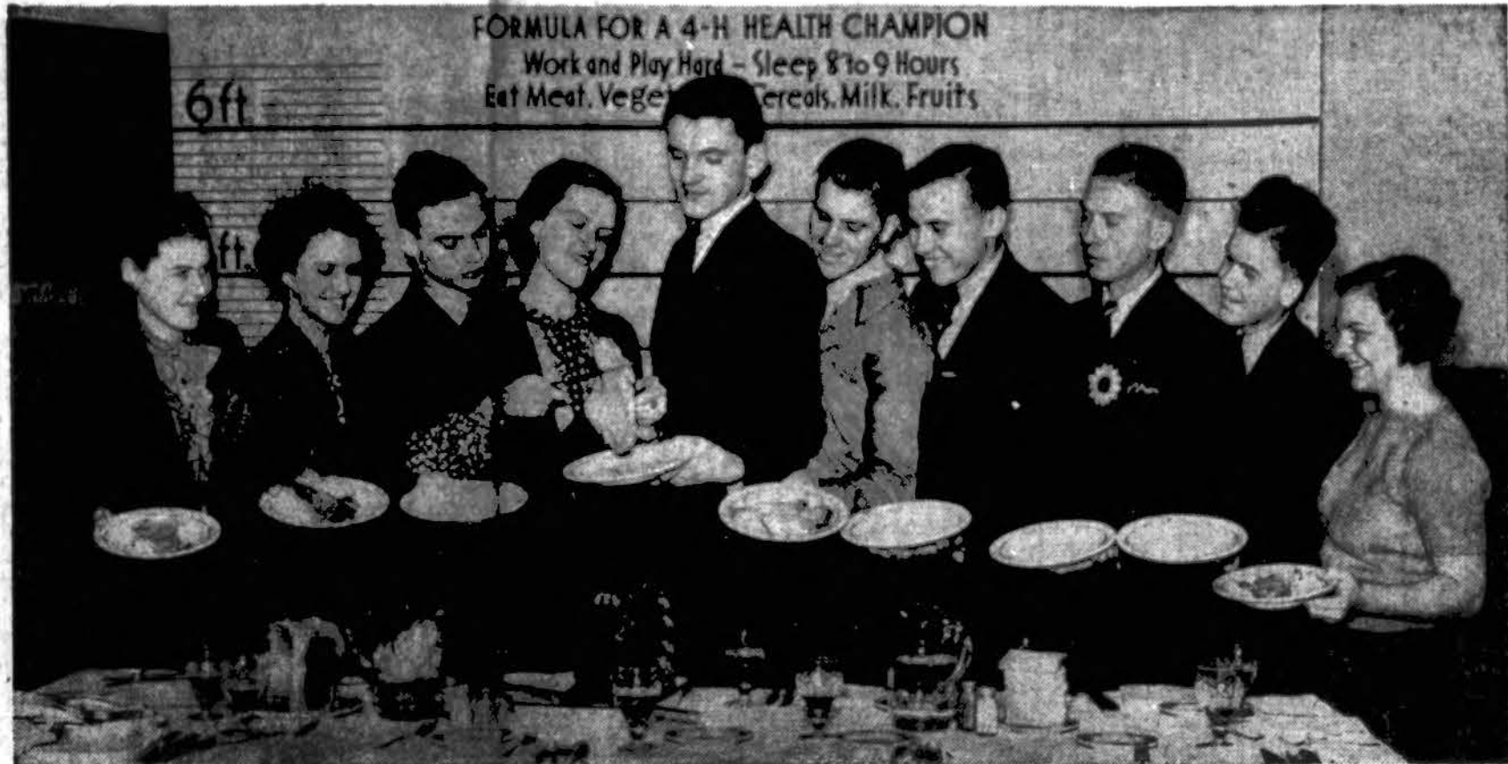
FORMULA FOR A 4-H HEALTH CHAMPION Work and Play Hard - Sleep 8 to 9 Hours Eat Meat, Vegetables, Cereals, Milk, Fruits