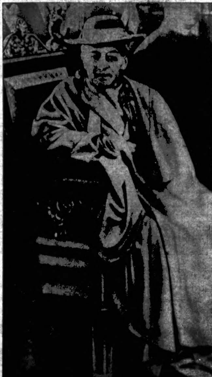
JO ŠVENTENYBĖ POPIEŽIUS PIJUS XI. Nuotrauka padaryta per Etrusco muziejaus Romoje šimtmetinių sukaktuvių iškilmes, kuriose Popiežius dalyvavo. Jo šventybės veide ryškiai matosi didelis nuovargis.