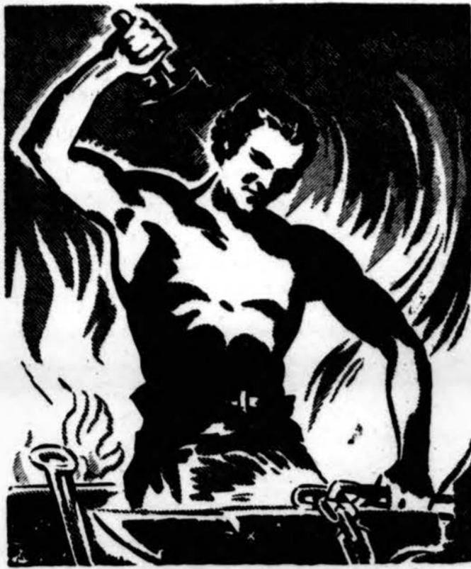
KOL JAUNAS, O, BROLI, DIRBK!

— Mano ponas šį rytą jau sugrįžo ir tamstą priims.