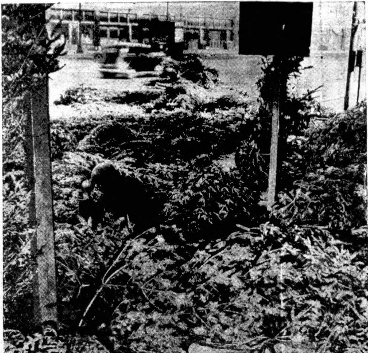
Po švenčių. Vienas Chicago pirklių krapšto pakaušį, kad neturi kur kalėdinių eglėlių dėti. Šiomet Chicagon tiek daug priversta, kad tūkstančiai liko neišparduotų.

Šis didysis Lietuvos Nepriklausomybės 20 m. sukaktuvių minėjimas bus sekmadienį, vasario 20 dieną, Ashland Auditorijoje. Šmt.