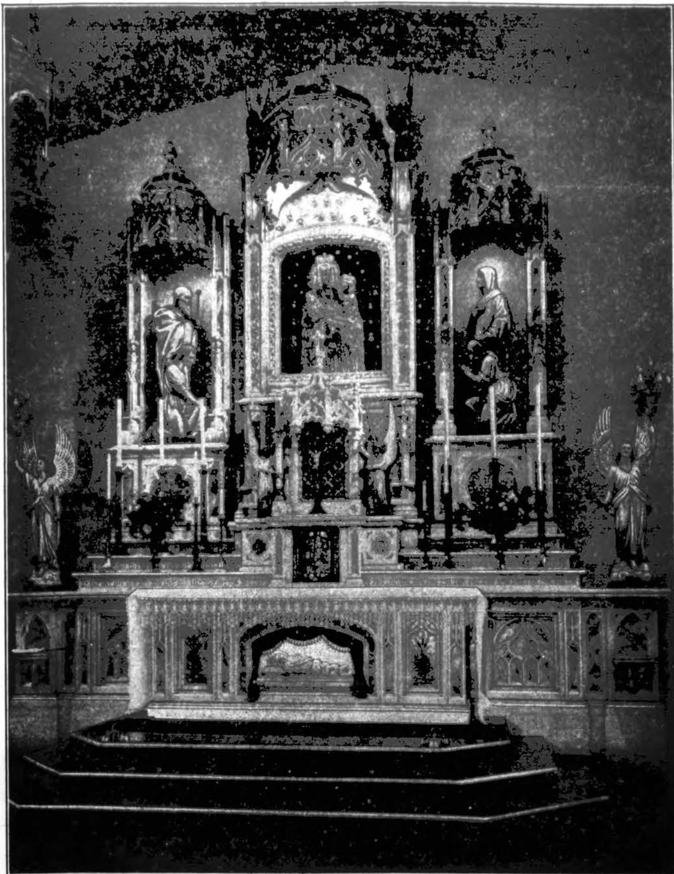
Gimimo Pan. Švenčiausios parap. bažnyčios, Marquette Park, Chicago, didysis altorius, kuriame randasi kopija stebuklingojo Pan. Švenčiausios paveikslo Šiluvos bažnyčioje, Lietuvoje. Šioj parapijoje sausio 2 d. prasidės katalikiškos spaudos vėjus, kuriam vadovaus pats klebonas.