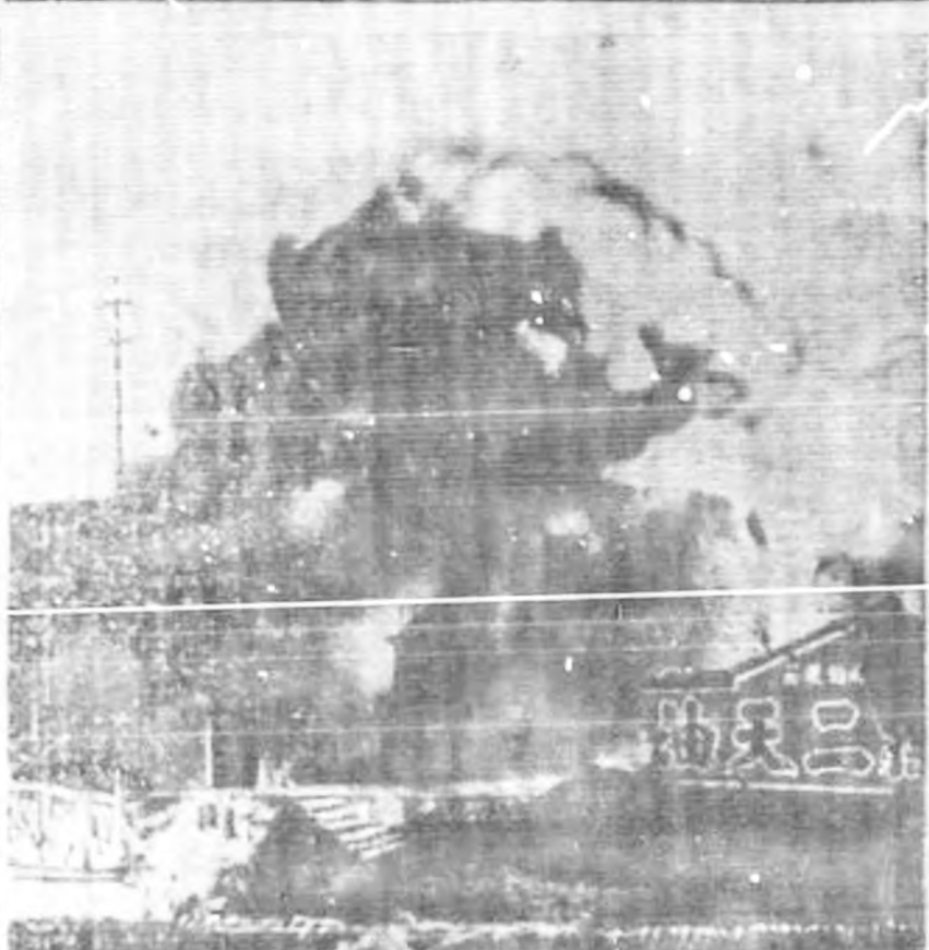
Iš kinų - japonų karų. — Sunkioji japonų artilerija davo istorinę kinų Kiangyin mūro sieną - tvirtovę į šiaurę nuo Nankingo.