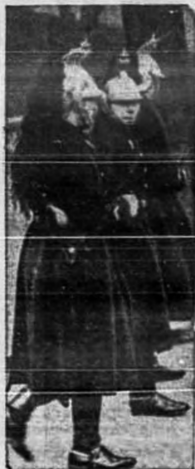
Prancūzijos respublikos gvardijos uniforma. Pastarojo generalio streiko ir neramumų metu ši gvardija saugojo Paryžių.