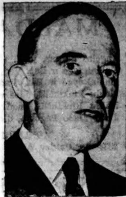
Francis B. Sayre, A. J. V. sekretoriaus padėjėjas, prez. Roosevelt paskirtas aukščiausias komisijonierium Phillipine saloms

Joana pagaliau paklausė ir nuvyksta pas karalių Karolį VII. Išsyk jos nenori prileisti: kas patikės, kad ta pa-