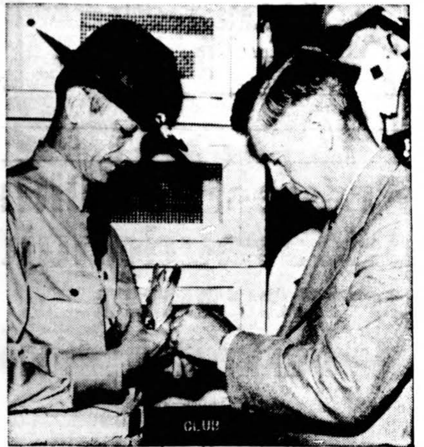
Cleveland, Ohio, atidaryta tautinė paukštinkystės paroda. Agrikultūros sekretorius Henry Wallace (dešinėj) kariuomenės balandėliu siunčia prez. Rooseveltui sveikinimą

Čia pat norime pasisakyti, kad negalima pritarti nekultūringai kovai prieš žydus ar prieš bet kurią kitą tautą, tačiau įgimtas sveikas savisaugos instinktas kiekvieną žmogų įpareigoja rūpintis savo artimųjų gerove. Iš to ir plaukia lietuvių pareiga rūpintis savo tautiečių visokeriopa gerove. Prekyboje glūdi turtai, joje klesti ir asmenų kūrybinių jėgų plėtotės galimūmai. Prekyba