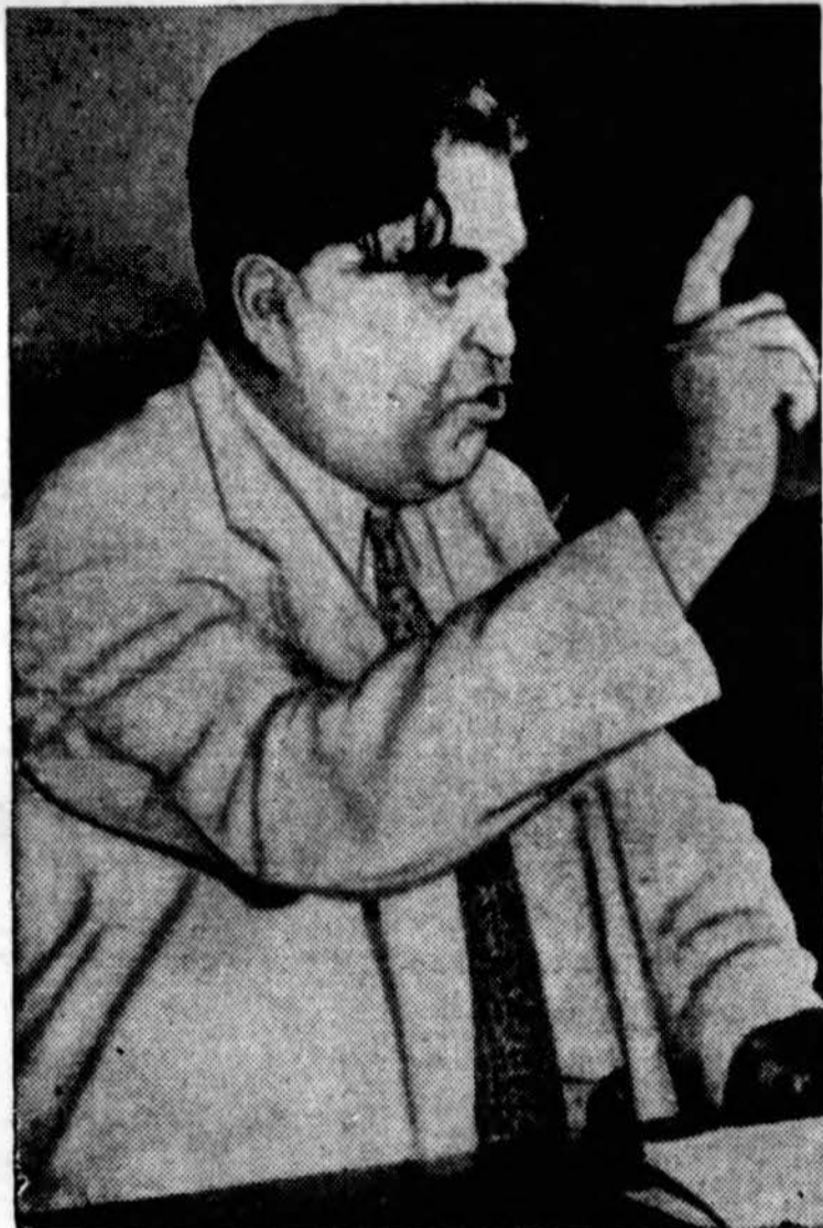
CIO diktatorius John L. Lewis parodomas, kaip jis kongreso žemesniųjų rūmų darbo komiteto posėdyje puolė vice prezidentą J. N. Garner, kaip buvo rašyta "Drauge" šeštadienio num.

Piknikas prasidės 12 val. popiet. Vakare bus progos visiems lietuviams ir biznieriams ir profesionalams pas choristus atsilankyti. Be to, mums širdžiai kviečiami ir mūsų dvasios vadai, kuriems bažnytinis choras yra arčiausia širdies. Nes parapijos savo giedojimu puošia pamaldas, ir prisideda prie įvairių parapijos bei vietinių draugijų rengimų. Jaunimo smagumui, šokiams grieš viena geriausių orkestrų. Rengiama graži programa. Lietuivyti