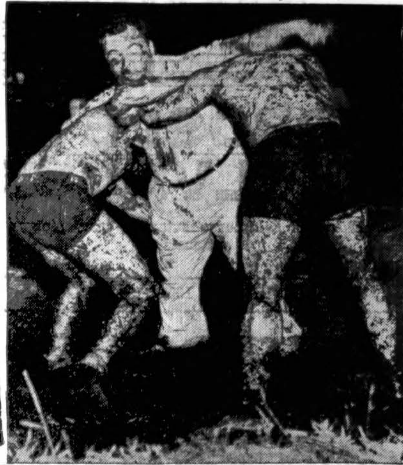
Manistique miestely, Mich. val., kas met esti tradicinė mėlynų (uogų) šventė. Šiemet programoj buvo ir ristinės. Ristikai turėjo imtis estradę, kurioje hubo papilta keliolika bušelių mėlynų. Po ristinų abu ristikai ir teisėjas buvo mėlynai.