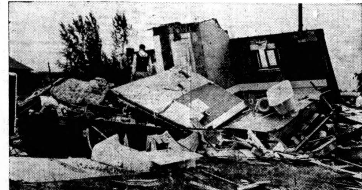
South Comstock, Mich., anadien audros sugriauti namai. Čia vaizduojama tik pora nutentėjusių namų. Ten sugriauta jų daugiau, 1 asmuo žuvo ir kelioka sužeista.