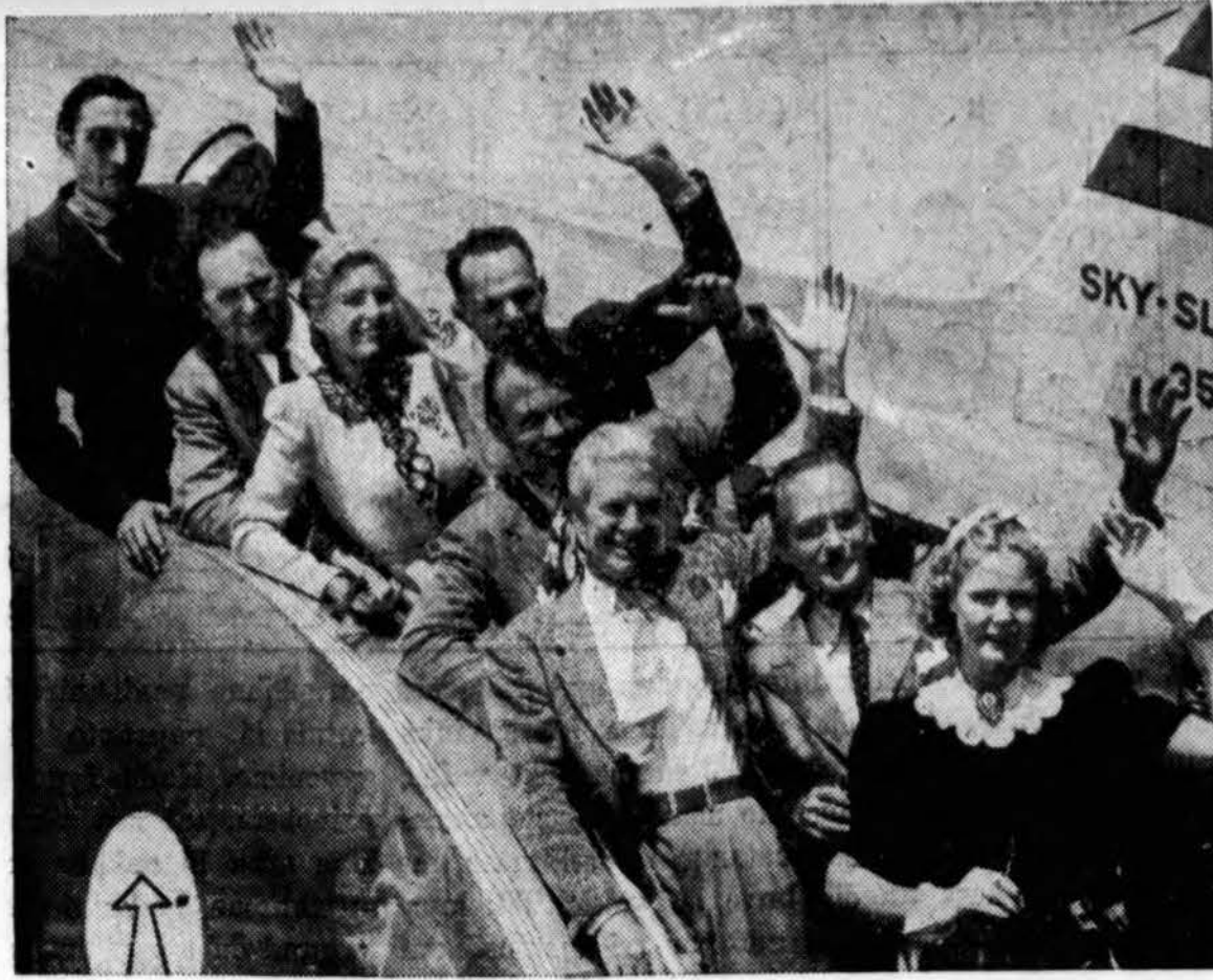
Būrys kino artistų, nariai Screen Actor's gildijos, iš Hollywood vyksta į Atlantic City, N. J., patiekti Amerikos Darbo Federacijos Pildomajai Tarybai skundą prieš scenų paruošimo filmavimui uniją.

pie 17 m. aukščio, t. y. tiek, kad upė būtų sunaudota iki pat Vilniaus krašto sienos; iš šios užtvntkos vandenį kanalu perleisti į Verknės slėnį prie Birštono ir čia pastatyti antrą užtvanką. Šiuo projektu abi užtvankos duotų apie 50,000 kw., bet jis būtų pats brangiausias (apie 60 mil. lt. be tinklų). Nemas prie Pažaislio su užtvanka apie 14 m. t. y. tiek, kad paspiris būtų suderinta su Birštono užtvanka, duotų apie 23,000 kw. energijos. Neris numatoma sunaudoti jėgai taip pat du kartus: prie Kleboniško su užtvanka apie 10 m. aukščio, kur galėtų būti gauta apie 11,000 kw. ir aukščiau Jonavos prie Skurulių su užtvanka apie 17 m. aukščio ir vandens paspiriu iki Vilniaus krašto sienos ir Ukmergės. Ši užtvanka duotų apie 20,000 kw. Neris užtvanka prie Skurulių ir Nemuno užtvanka prie Pažaislio kiekviena kainuotų tarp 25-30 mil. lt. Šiuo metu pasidarė labai aktualūs elektros reikalai Vakarų Zemaitijoje: yra reikalo praplėsti Palangos, Kretingos, Plungės elektrines ir duoti elektros energiją Šventajai. Šiame rajone norima pastatyti hidroelektrinę ant Minijos, iš kurios galima būtų gauti apie 1,200 kw. energijos ir kurios prie dabartinių sąlygų pakaktų ilgesniam laikui. Ateityje numatoma Minijos elektrinę sujungti per Telšius ir Kuršėnus su Rekyvos šilumine ele-