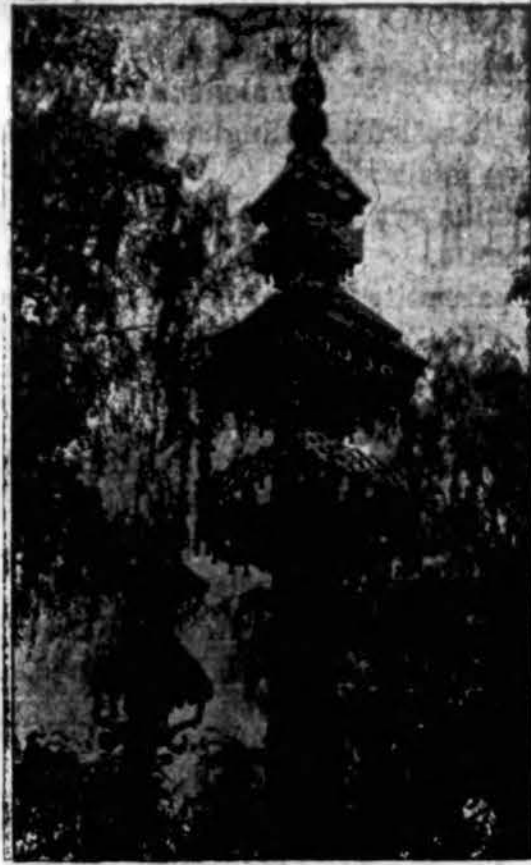
Vienas iš Lietuvos kopyltstulpių. Tokie kopyltstulpiai puošia visas Lietuvos pakeles.

Viso Lietuvos Dienoje dalyvauja 70 chorų su 3,000 dainininkų; net ir iš Canada du