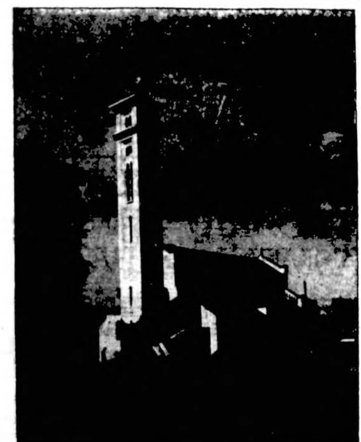
Kybartų (Lietuvoj) katalikų bažnyčia.