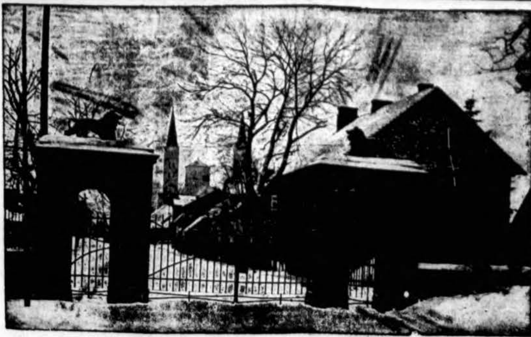
Vienas Rietavo miestelio vaizdų.

lenkų vyriausybė steigia įvairius fabrikus, remia pramonę kad žmonių perteklius kaimuose gautų darbo įmonėse. Tikrai, naujai įkurtose įmonėse šimtai darbininkų buvo vis jauni žmonės, surinkti iš pertekliaus kaimuose, ir išmokslinti dirbti fabrike. Prie fabričių matėme tų pačių fabričių įsteigtas mokyklas, kurios paruošia fabrikui specialistus. Kvalifikuotas darbininkas daugiau uždirba, bet ir pats fabrikas sustiprina savo personalą darbininkais specialistais. Jis darosi pažėgesnis ir tikresnis. Fabrikai dirba įtemptai, daugelis jų varo tris pakaitas, tad ir žmonių sutraukia labai daug. Uždarbis esąs nuo 60 grošų ligi 2,50 gr. valandai, pagal išmokslinimą ar specialybę.