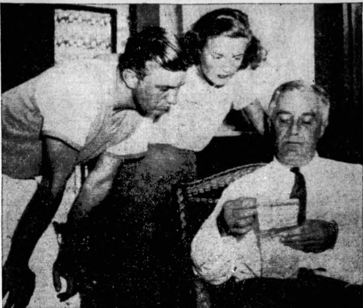
Amerikos J. V. prezidentas Roosevelt su savo sūnum ir marčia atostogose Campobello saloje, New Brunswick. Iš šia prezidentas, saiko, paskelbsias deklaraciją, kad šiemet Padėkos Diena (Thanksgiving Day) būtų švenčiama ne lapkričio 30 dieną, kaip kasmet esti, bet lapkričio 23 d. Sako, visuomenė reikalaujanti, kad dviejų švenčių (Padėkos Dienos ir Kalėdų) tarpas būtų ilgesnis. Padėkos diena nėra konstitucijinis dalykas, dėl to, sako, prezidentas galis ją perkelti į kitą dieną.

Vadai, primyn su savo kolonijomis! Žvalgas