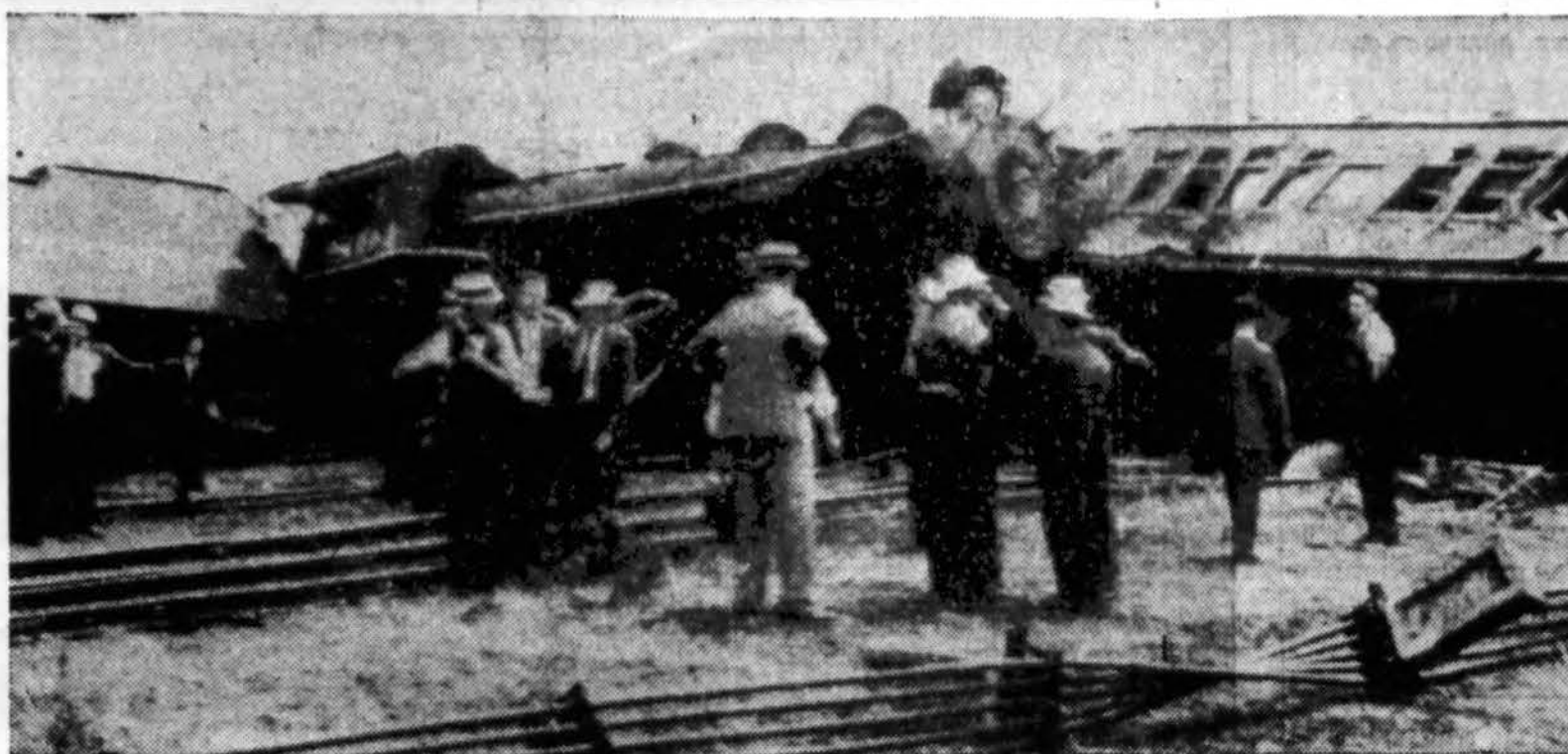
Beveik tuo pačiu laiku, kaip įvyko šiurpi katastrofa su liuksusiniu traukiniu "City of San Francisco", Denver, Colo., susidūrė du Sante Fe keleiviniai traukiniai. Nelaimėje žuvo vieno traukinio konduktorius ir 35 keleiviai sužeista.

Siemet labdarių ūkyje yra daug riešutų. Labdarys