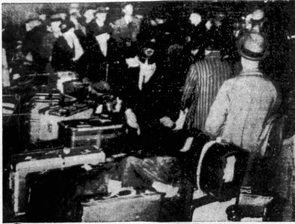
Londono geležinkelio stotis užsikimšus amerikiečiais, grįžtančiais namo. Ne tik iš Anglijos, bet ir kituose kraštuose Amer. J. V. ambasadų įsakyta amerikiečiams tuojuo grįžti namo.

Aukščiau buvo pasakyta, kad privatinė nuosavybė gali būti asmeninė ir bendroji arba kolektyvinė, priklausanti šeimai, įmonei ar įstaigai. Tačiau čia paminėtos kolektyvinės nuosavybės negalima lyginti su kapitalizmo sukurtu