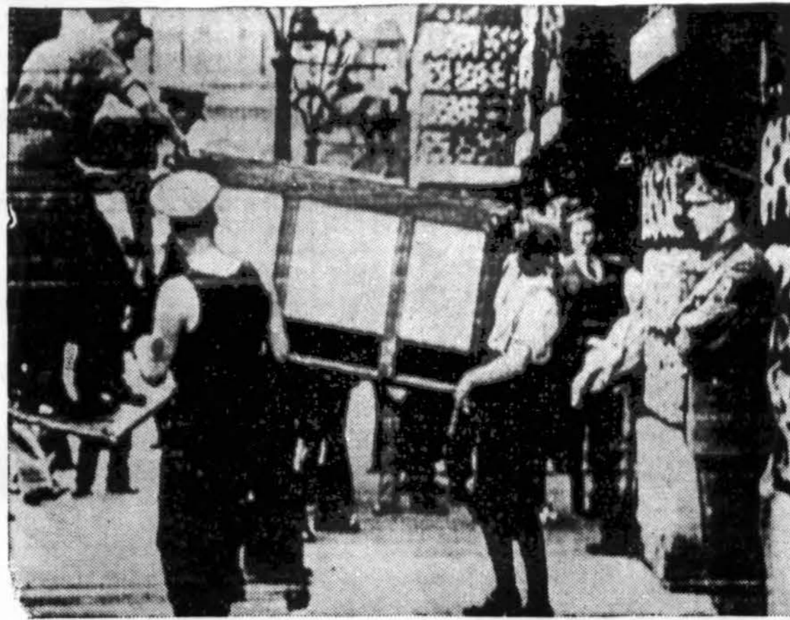
Did. Britanijos vyriausybės archyvas iš Londono perkeltas į tik vyriausybei žinomoj vietoj paruoštą saugią nuo kanuolių ir lėktuvų slėptuvę.

Iš aukščiau pasakyto, galima suprasti, kad Bažnyčios pažiūros į nuosavybę yra tarpinės tarp kapitalizmo ir socializmo pažiūrų. Kapitalizmas teigia, kad nuosavybės turėjimas ir jos naudojimas esąs išimtinai individualinis arba asmeninis (nors kaip pradžioje straipsnio pasakėta, kapitalizme nuosavybės turėjimas yra pasidaręs kolektyvinis arba bendrinis). Socializmas gi tvirtina, kad nuosavybės turėjimas ir jos naudojimas esąs kolektyvinis