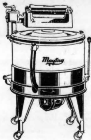
SKALBIAMOJI MAŠINA, antroji dovana, $75.00 vertės Iš PEOPLES FURNITURE CO., 4149 Archer Ave.