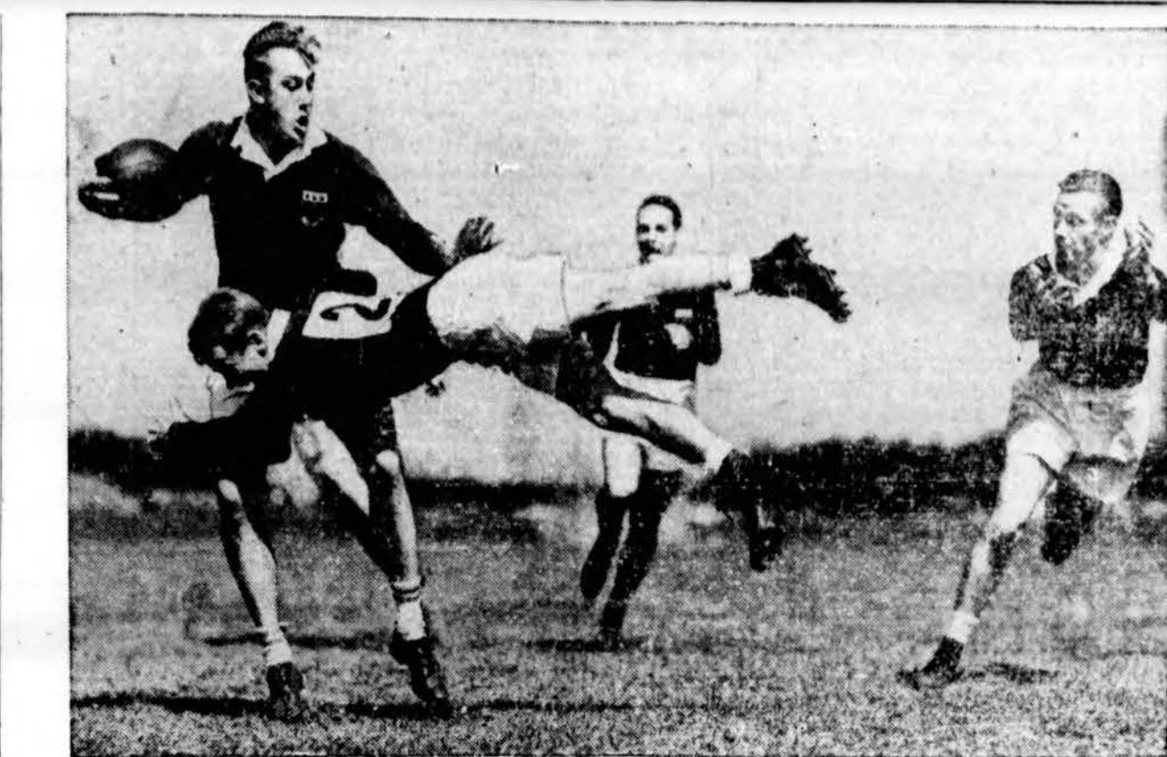
Futbolo sezonui prasidedant praktikuojama si.