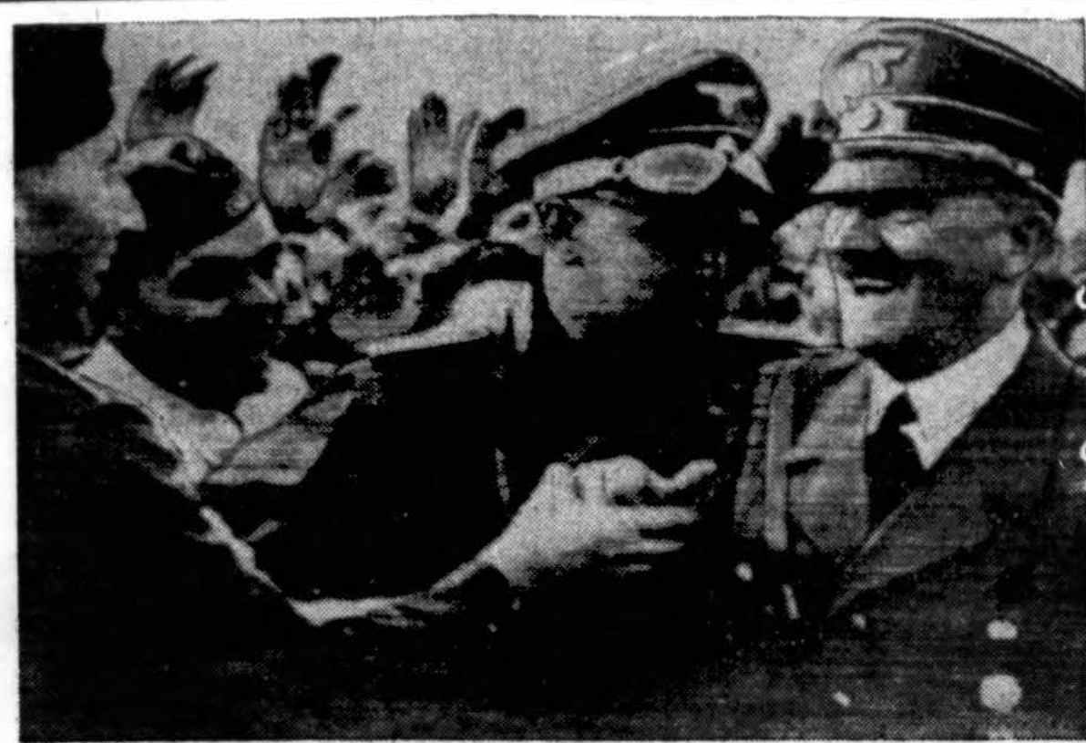
"Kur nors Galicijoje" Hitleris šiltai sutinkamas vokiečių karininkų.