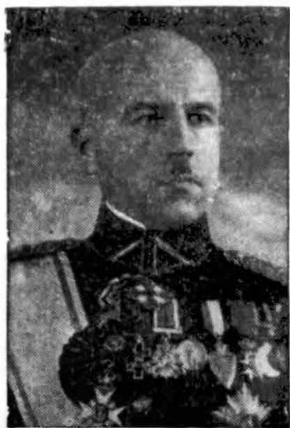
Lietuvos kariuomenės vyriausias vadas gen. S. Raštikis, kuriam vokiečių karo vadovybė pareiškusi, kad Lietuva gali atsiimti Vilnių.

Todėl ne tik Lietuva, bet ir kitos Pabaltijo valstybės turi susirūpinti ir tartis tarp savęs ir su Anglija dėl apsigynimo ar globos. Tikėtis užtikrinimų nėra ko. Paskui gali būti per vėlu šauktis ar tartis, kaip lenkų ultimatumo ir Klaipėdos įvykių laikais. Lietuvos noras būti nepriklausomai