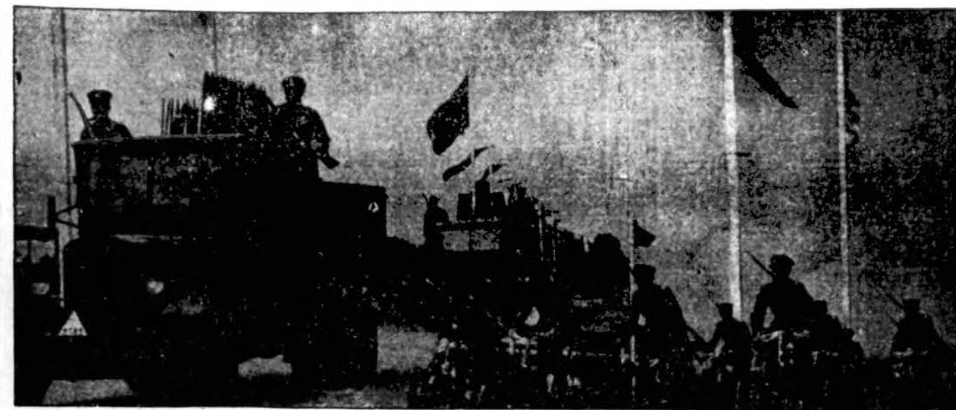
Lietuvos kariuomenės motorizuotoji, pilnai aprūpinta dalis vyksta į Lenkijos pasienį budėti tėvynės nepriklausomybės sargyboje ir būti pasiruošus, vyriausybei įsakius, užimti Lenkijos applėštą Vilniaus kraštą su sostine Vilniumi.