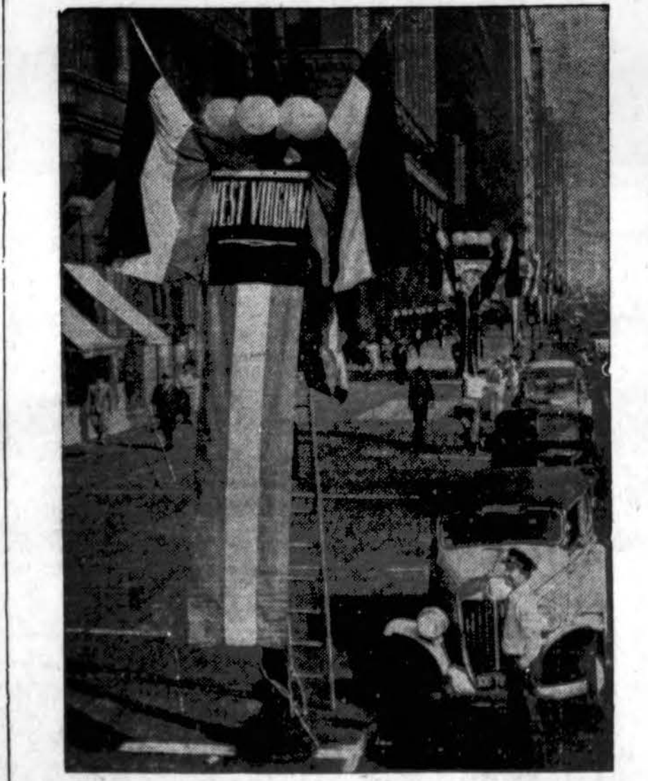
Michigan Avenue, Chicagoj, papuošta Amerikos Legijono metinio suvažiavimo proga. Suvažiavimas prasidės pirmadienį, rugsėjo 25 d.

MODERN COOKERY... CONSTANT HOT WATER... SILENT REFRIGERATION... GAS HEATING THE PEOPLES GAS LIGHT AND COKE COMPANY