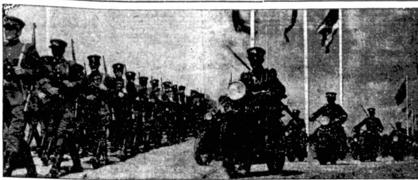
Vienas Lietuvos kariuomenės pėstininkų pulkų, šale kurio ir dalis motorizuotos kariuomenės, traukia į karo vadovybės nurodytas pozicijas. Visų veiduose rimtis, nes įvykiai kasdieną keičiasi.

Prie šios progos turiu priminti Lietuvos mažą rūpestį karių ir civilių priešdujine apsauga ir nuo kitų kariškų naikinimų apsaugojimu. Reikia kariuomenės, skaitlingų šaulių būrių ir visoktos rūšies ginklų, bet taip pat yra būtina tikra žmonių apsauga. Stebėtis tenka, kaip tie lietuviai prie visko priprato ir nebijo. Čia pat kaimynystėje žūbūtinis karas eina, o Lietuva kad ką darytų nieko negirdėt. Valdžia turi į liudį siųsti instruktorius-žinovus pademonstruoti paruošti slėptuves civiliams ir pamokyti juos dujakaukes vartoti. Dabar laikas ne "darbo talkai", bet prieškarinei apsaugai talka reikalinga. Šaulių Sąjunga per vietos šaulių būrius turi tas instrukcijas praveisti ir tuojau sukurti specialų lėvės ir su Anglija dėl apsigynimo ar globos. Tikėtis užtikrinimų nėra ko. Paskui gali būti per vėlu šauktis ar tartis, kaip lenkų ultimatumo ir Klaipėdos įvykių laikais. Lietuvos noras būti nepriklausomai