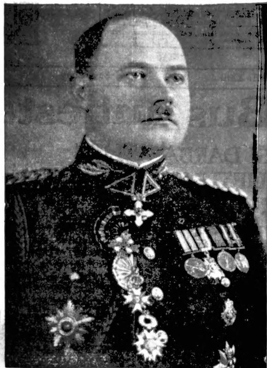
Lietuvos premjeras gen. Černius, kuriam vyriausias Lietuvos kariuomenės vadas gen. Raštikis, grįžęs iš Vokietijos į Kauną, pranešė, jog Vokietijos karo vadovybės pareiškus kad Lietuva gali atsiimti Vilnių.