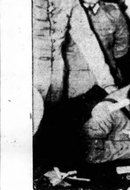
Balstogėje karo veiksmų vadai: kairėje vokiečiai — naciai, o dešinėje rusai — bolševikai, dalinasi Lenkiją. Nuotrauka atsiųsta iš Berlyno. (Acme telephoto)

Ausų įdegimas kūdikiuose pasižymi aukštu karščiu ir nepaprastai dideliu skausmu. Liga diagnozuoti tegalima tik išgaminavus kūdikio ausis. Mat, jis negali nei pasakyti