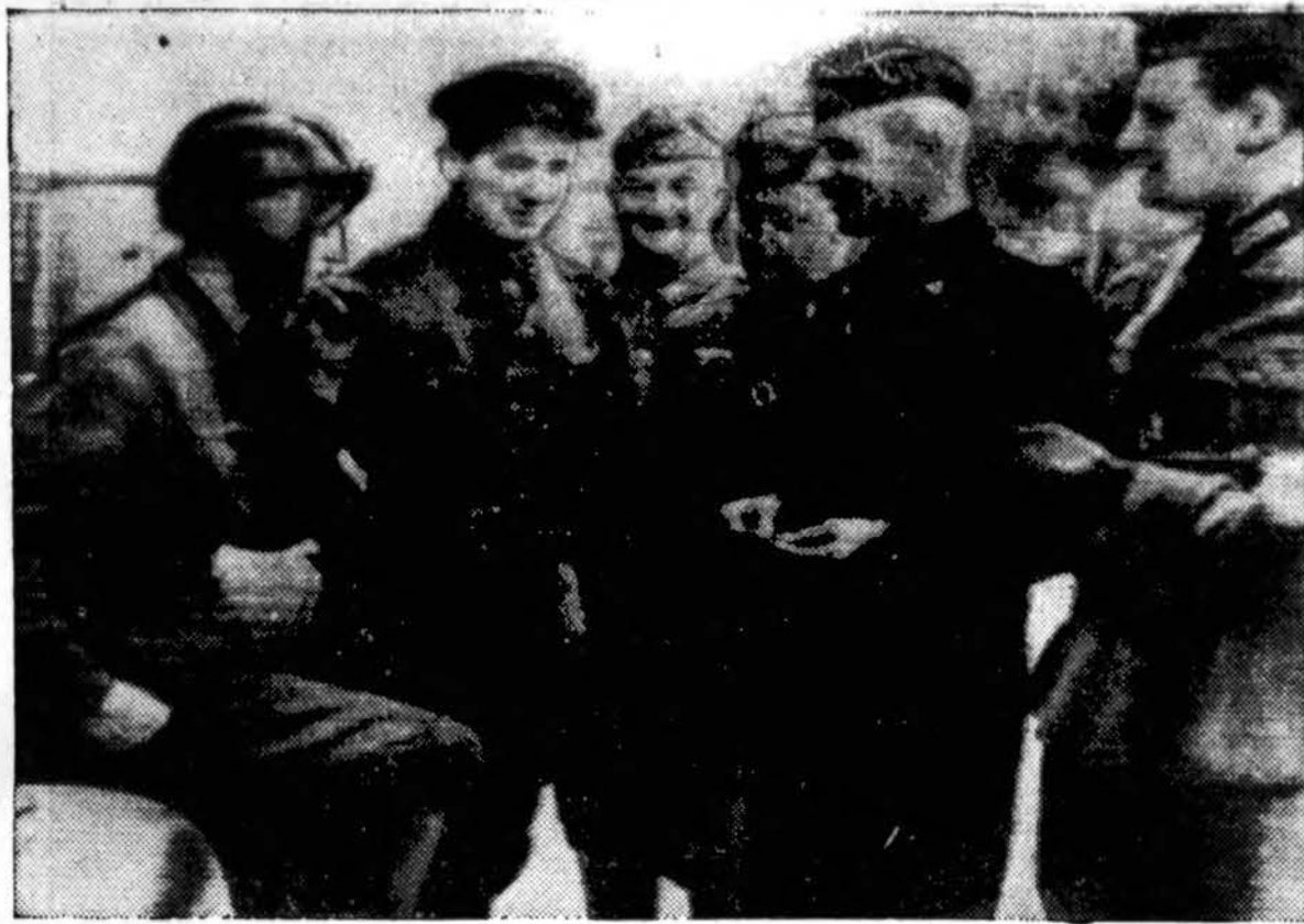
Rusų komunistų kareiviai (du kairėj) draugauja su vokiečiais kareiviais Brest Litovske. Pažymėtina, kad prieš 21 metus tame mieste vokiečiai rusams bolševikams diktavo sunkias taikos sąlygas. Dabar viskas pamiršta, dabar naciai ir komunistai geriausiai draugai.

Dėl kai kurių autobusų stovyks, kurias man teko matyti čia noriu padaryti sveikos kritikos pastabą. Pas mus Amerikoje ir visur kitur kur tik yra turistų suvažiavimo centras tokius centrus parenka gražesnė miesto daly, geriau imponuojančioji, žmonės irgi parenkami kurie turi keleivius priimti ir išleisti. Lietuvoje kaip kur mažesnėse autobusų stotyse to nepastebėjau, priešingai, jei spresti kraštą iš žmonių kurie keleivius