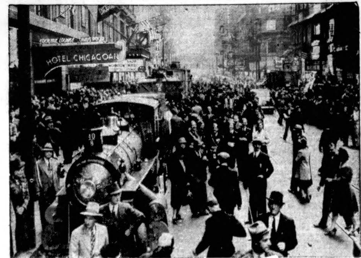
Madison gatvė Chicagoj per Amerikos Legijono konvenciją, kuri dideliu paradu baigsis šiandie.