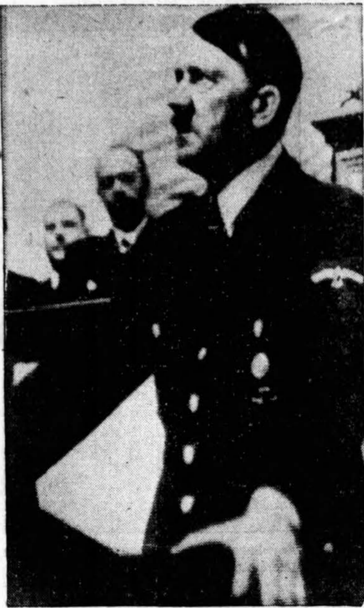
Hitleris kalba reichstage.