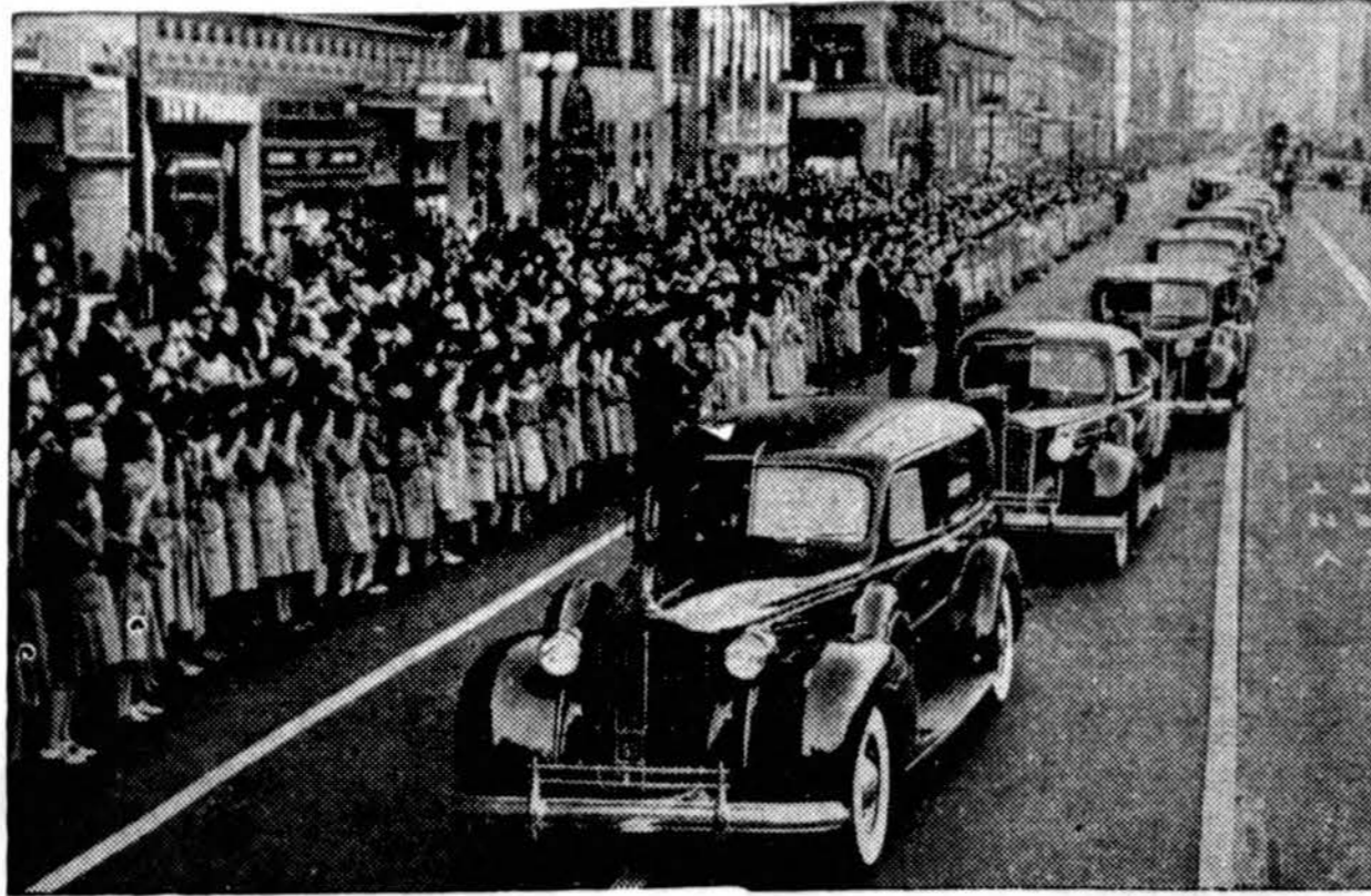
Paskutinė kardinolo Jurgio Mundelein kelio nė į St. Mary of the Lake seminariją, Mundelein, Ill. puošnia Chicago gatve — Michigan Ave. — iš Šv. Vardo katedros. Šimtai gedulu pauostų automobilių ir šimtai tūkstančių abiem gatvės pusėn susikaupusių tikinčiųjų palydi mylimojo Ganytojo palaikus į amžinojo atilsio vietą.

Šiandie spalio Devintoji. Prieš devynioliką metų mūsų istorinė sostinė Vilnius su treč daliai Lietuvos buvo lenkų užgrobita. Vargo, skurdo, kentė priešpaudą lietuviai patekę lenkų nelaisvėn. Laikydami prie spaudoj mažumas ir visokiais būdais persekiodami lenkai nematė, kad tuo jie kasa duobę sau, savo nepriklausomybei. Šiandie Lenkijos jau nebėr ir niekas negali drąsiai sakyti, kad ji bus atsteigta. Mūsų sostinė Vilnių ir visas buvę po lenkais žemės dabar užgrohė bolševikai. Gyveną ir dirbą Rusijai Amerikos lietuviai (bolševikai) pastaruoju laiku visur skleidžia kalbas, kad bolševikai Vilnių buvo siūle Lietuvai, bet Lietuva atsiskakė ji pasiimti? Ar taip buvo? Iš kur tos kalbos? Kokių tikslu jos skleidžiamos. Jei, iš tikrųjų, buvo siūlyta Lietuvai Vilnius, dėl ko ji jo neėmė? Į šiuos ir kitus begalo įdomius klausimus bus atsakyta šį vakarą, minint spalio 9 d., Aušros Vartų parapijos salėj, po misijų, apie 9 valandą. Kalbės svečias iš Londono, tenykštės lietuvių para-