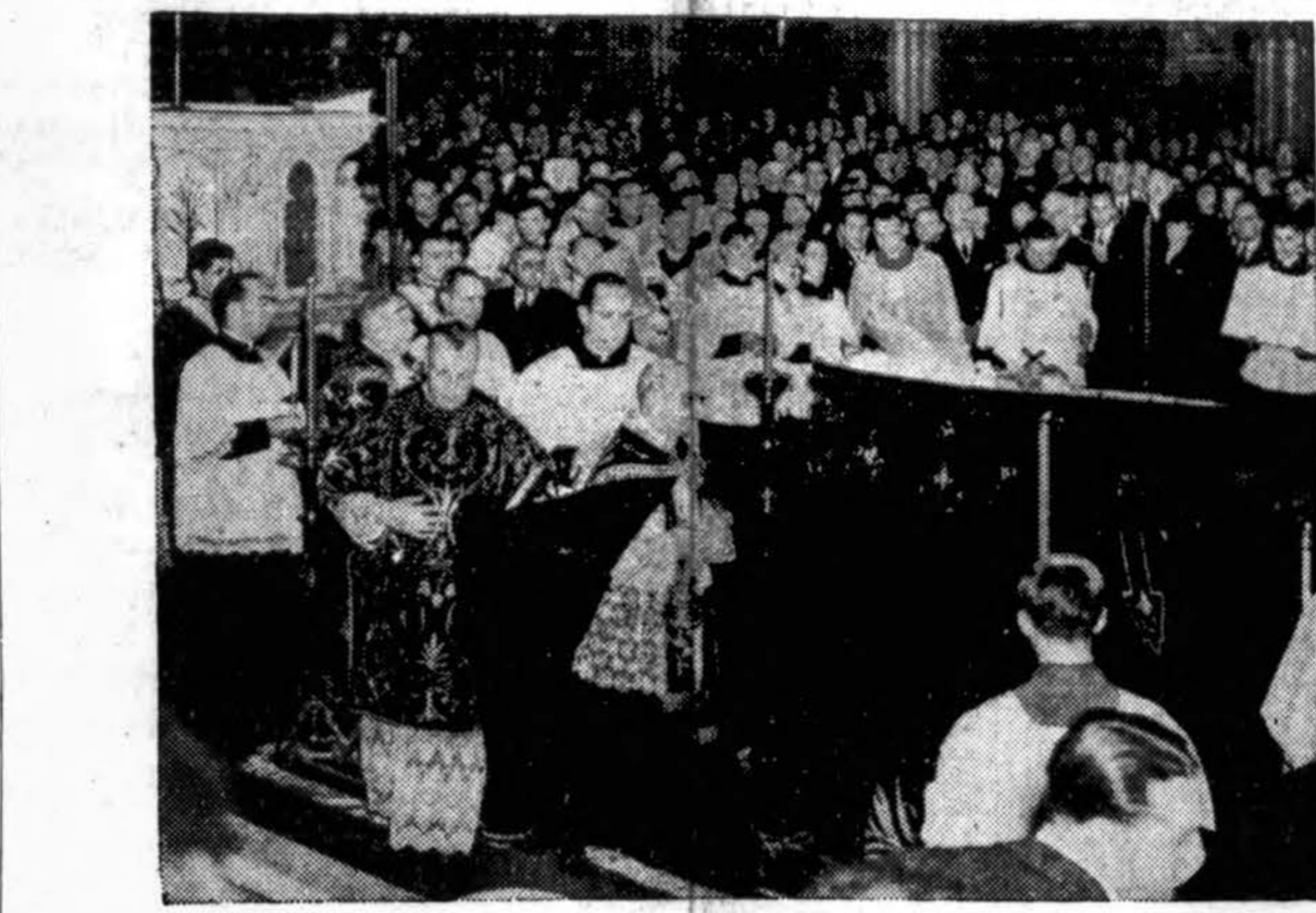
Iš a. a. kardinolo Mundeleino laidotuvių gedulo pamaldų katedroje vaizdas. Apaštališkas delegatas, J. E. Arkivyskupas A. G. Ciegnani, po Mišių smilko kardinolo karstą.

Žydų valstybės steigimo Lenkijos teritorijose sumany-mas paneigtas. Šį kartą Hitleris turi nau-