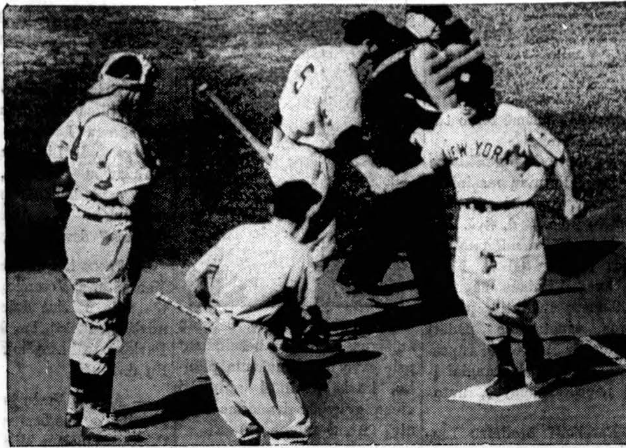
Momentas iš įtempto "world series" basebolo žaidimo Reds stadijone, Cincinnati, O. New Yankees laimėjo ir tretį žaidimą.

Kas ketvirtadienio vakarą, mokyklos salėje bus parapijos nauda jaunimo šokiai. Ir suaugę gali ateiti. Prano Pakėno lietuviška orkestra grie-