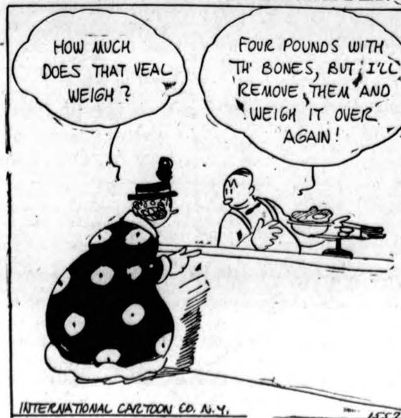
INTERNATIONAL CARTOON CO. N.Y.