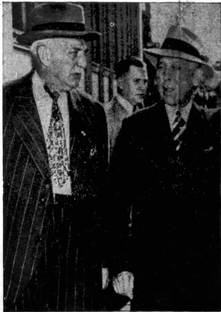
W. S. Knudsen (kairėje) ir A. P. Sloan, Jr., pirmasis General Motors bendrovės prezidentas, o antrasis tos bendrovės direktorių boardo pirmininkas, apleidžia federalinį teismą South Bend, Ind. General Motors bendrovė patraukta tieson už antitrustinio įstatymo peržengimą.

BERLYNAS, spal. 10. — Vokietijos ekonominė misija Maskvoje turi skubotas derybas su sovietais, nes Vokietijai labai reikalinga įvairi žaliųjų medžiaga.