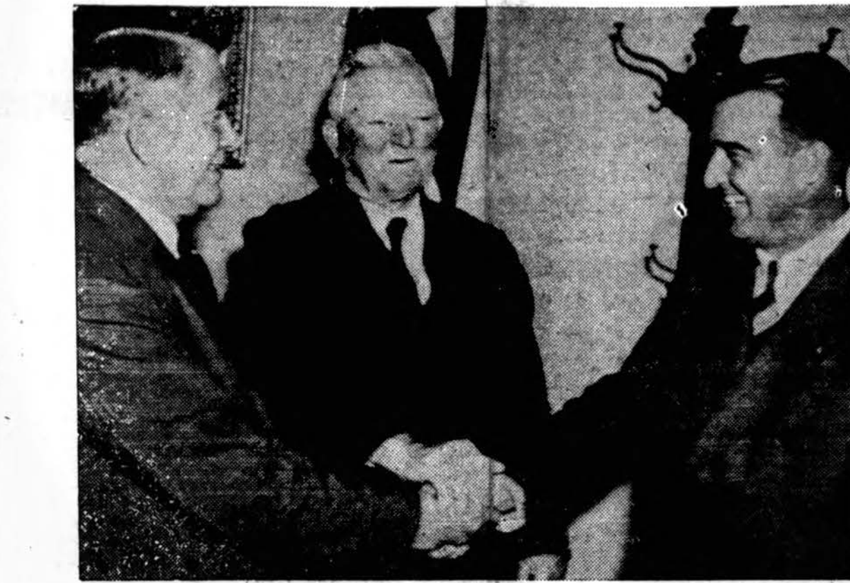
Naujas federalinis senatorius A. B. Chandler (dešinėje). Kairėje Kentucky sen. A. Barkley, o centre — viceprezidentas Gardneris. Senatorius Chandler pasitraukė iš Kentucky gubernatoriaus vietos ir paskirtas senatorium mirusiojo tos valstybės sen. M. Logano vietoje.