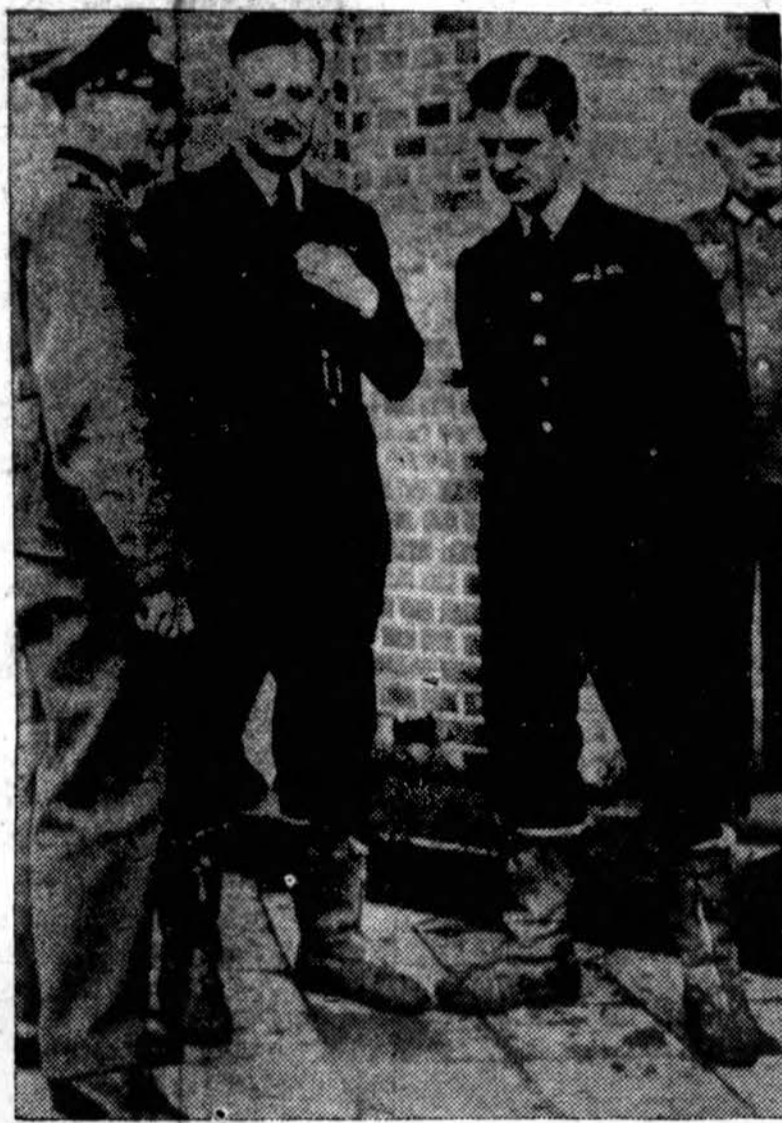
Du britų lakūnai paimti nacių nelaisvėn. Nelaisvių stovykloje jie kalbasi su nacių karininku (kairėje).

SPRINGFIELD, Ill., spal. 12. — Šiomet per 9 mėnesius Illinois valstybėje išduota 1,606,780 laisnių automobiliams — 55,872 daugiau nei perėjusiais metais tą patį laiką. Už laisnius iki rugsėjo 30 d. surinkta 23,401,290 dol.